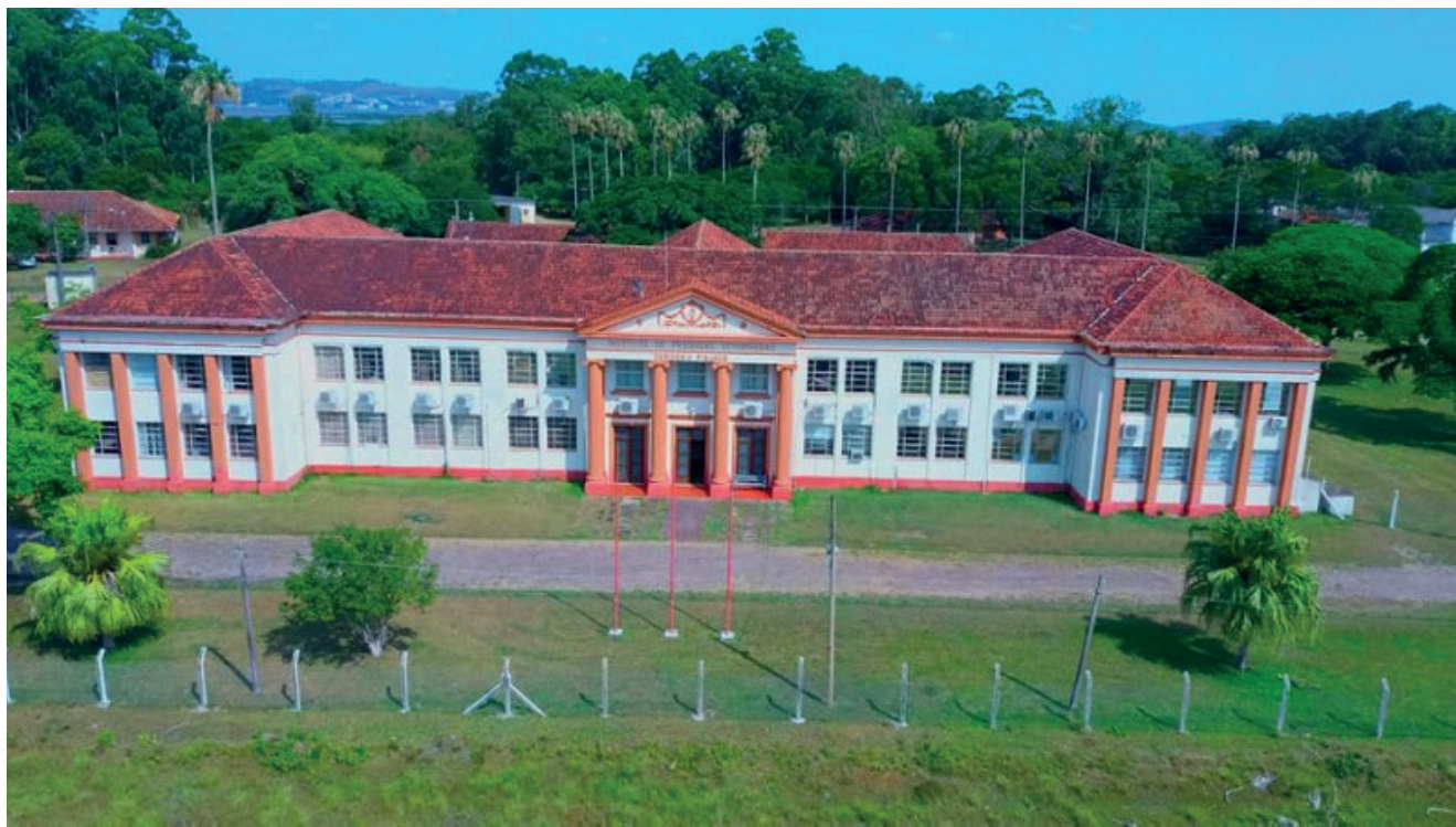
Centro de Pesquisa em Saúde Animal

O Mestrado em Saúde Animal é direcionado a graduados das áreas de ciências agrárias, biológicas, biomédicas ou ambientais, com o objetivo de capacitar, atualizar e aprimorar esses profissionais em aspectos científicos e tecnológicos da área de saúde de animais de produção, focando nas demandas das principais cadeias produtivas da pecuária gaúcha. Para isso, os mestrandos poderão contar com a estrutura e a experiência do IPVDF, há mais de 70 anos uma referência mundial em pesquisa e diagnóstico, além de ser laboratório oficial do governo do Estado para os progra-