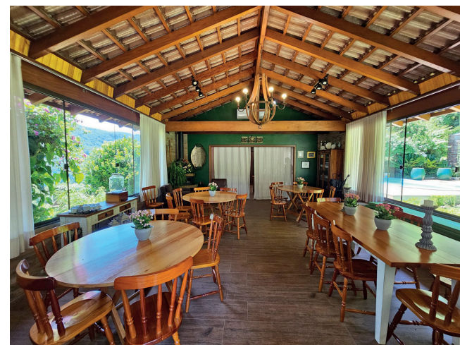
Espaço para eventos intimistas