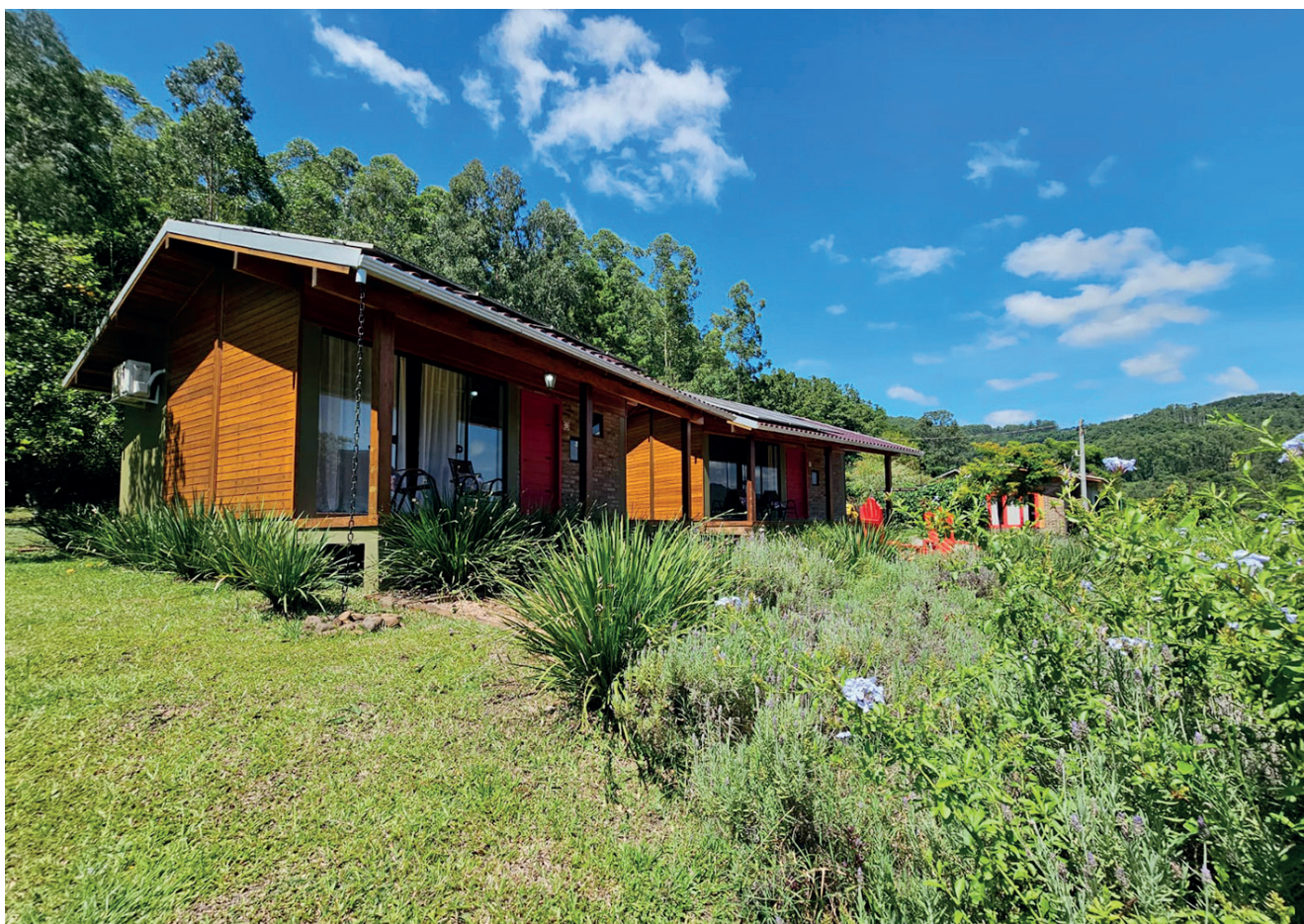
Os dois bangalôs, Lídia e Amábile acomodam até três pessoas cada