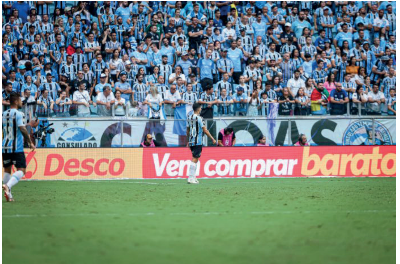
Em 2023 o Desco Super & Atacado também patrocinou o Gauchão

A primeira rodada do Gauchão foi no último final de semana, no meio da semana teve a segunda, e neste final de semana tem a terceira. Doze equipes disputam o título: Grêmio, Internacional, Caxias, Santa Cruz, Juventude, Avenida, São José, São Luiz, Guarany de Bagé, Ypiranga, Brasil de Pelotas e Novo Hamburgo. O Desco Super & Atacado é uma das bandeiras do Grupo Imec que tem 15 supermercados Imec e 14 atacados Desco, além da indústria de panificação Italianinho Alimentos e o engenho de arroz Líder do Sul. Atua nas regiões do Vale do Taquari, Vale do Rio Pardo, Vale do Jacuí, Serra Gaúcha, Campos de Cima da Serra, Vale do Caí, Vale dos Sinos, Vale do Paranhana, Região Carbonífera, Região Metropolitana, e na Capital do Estado.