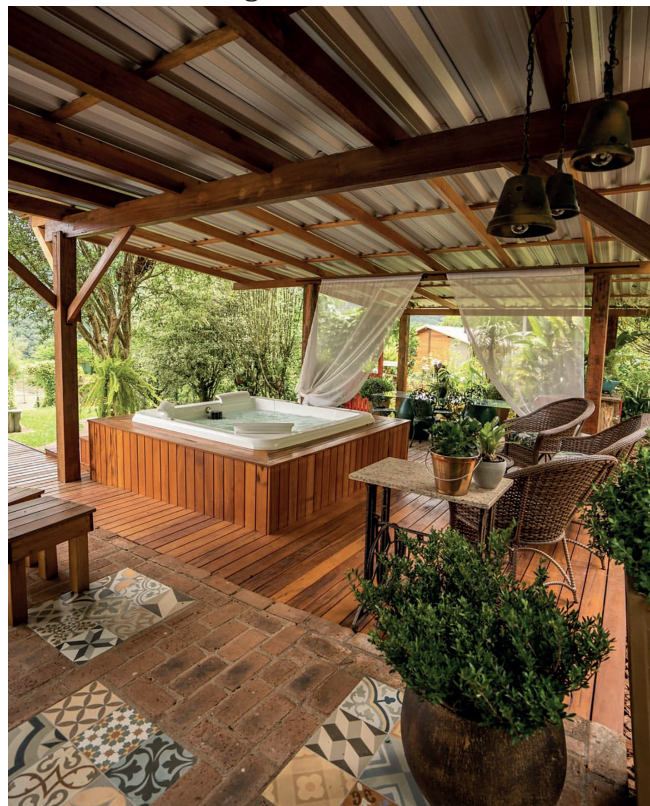
Hóspedes podem relaxar no jacuzzi

Quem se hospeda do Vivenda Altos da Glória pode passar os dias aproveitando o lugar que possui uma excelente estrutura com jacuzzi, piscina, cozinha compartilhada com fogão campeiro, fogo de chão, horta repleta de chás e temperos, trilhas em meio a natureza, redário, além é claro, da calmaria do interior que tem como melodia o canto dos pássaros. No Vivenda também há um espaço exclusivo para eventos intimistas que comporta de 15 até 35 pessoas, a culinária para esses eventos também é feita ali. Os pratos mais pedidos são a costelinha de suíno na cerveja, o pernil nas ervas aromáticas, espaguete ao molho pesto, e de sobremesa a torta de biscoito de chocolate e o tradicional sagu com creme.