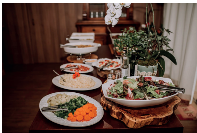
A culinária afetiva é um dos destaques do local