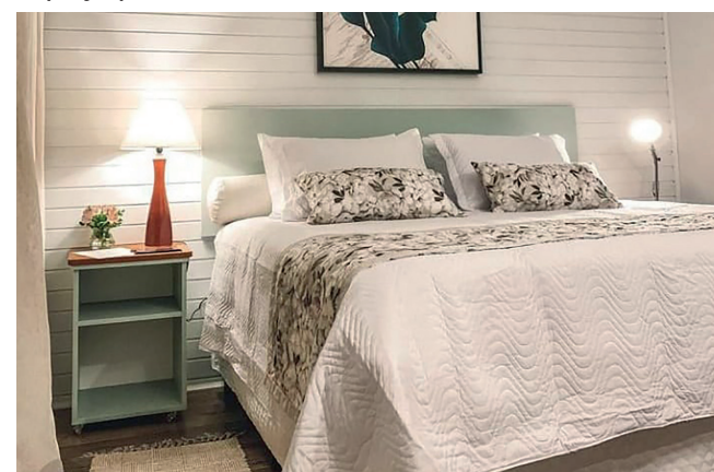
Bangalôs oferecem conforto e beleza aos hóspedes