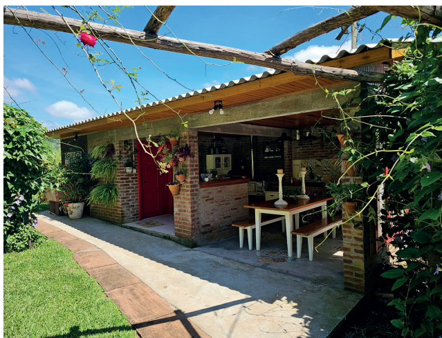
Cozinha compartilhada com fogão campeiro

Mais informações pelo (51) 99995-0091, no site www.altosdagloria.com.br ou nas redes sociais @vivendaaltosdagloria.