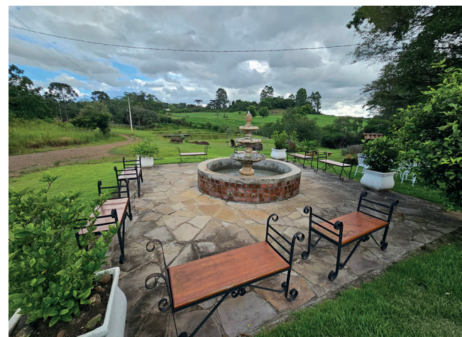
Espaço de contemplação junto a natureza