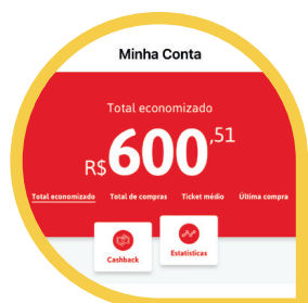
Cashback (MENU CONTA > CASHBACK)