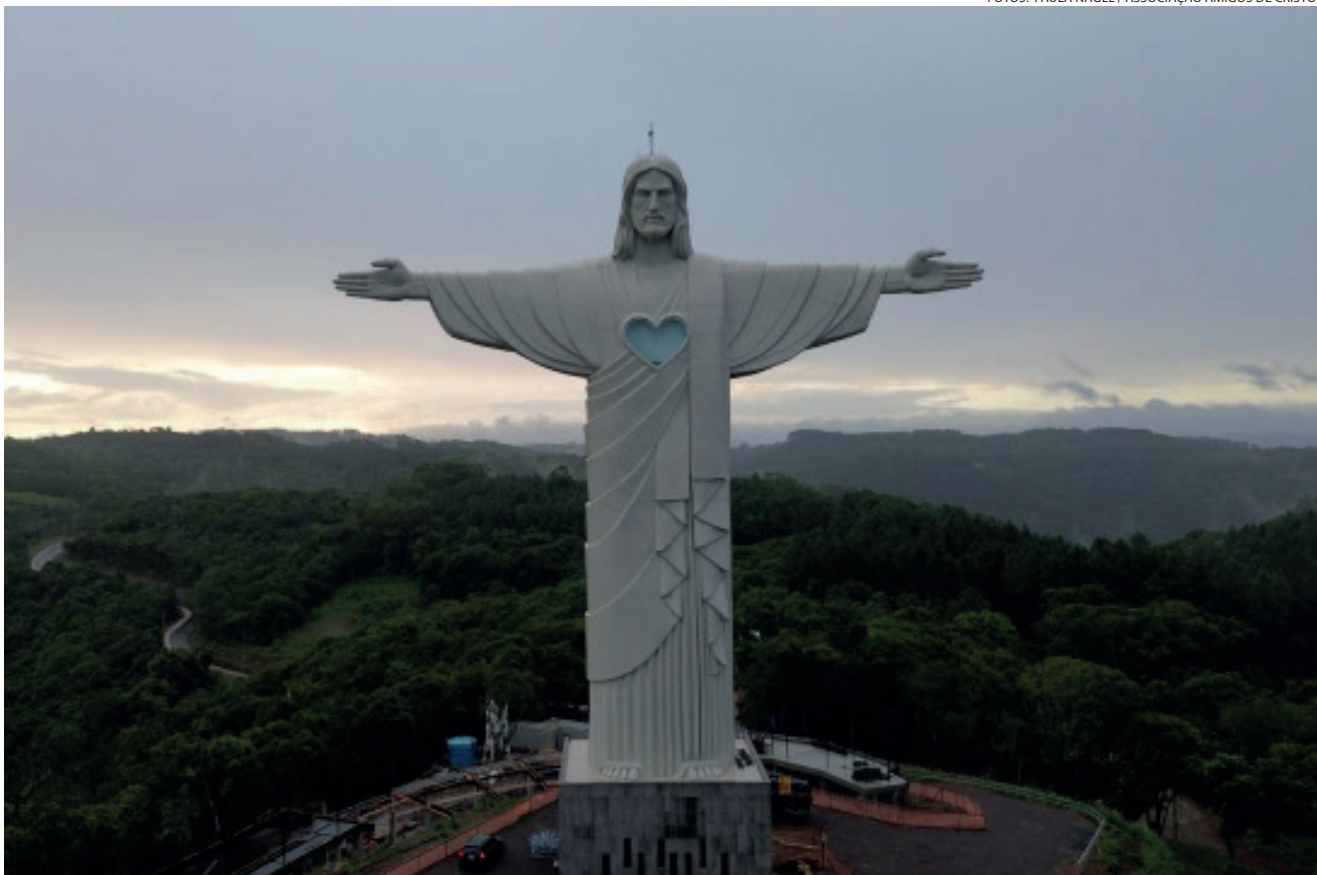
Cristo Protetor de Encantado   a maior  st tua de Cristo do Mundo