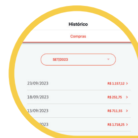
Seu Hist rico de Compras