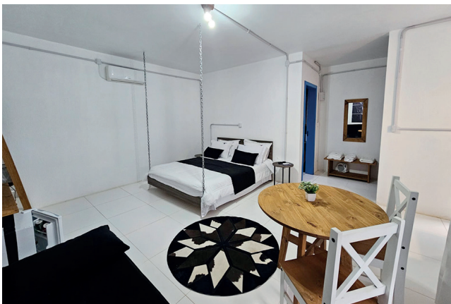
São seis quartos, todos com decoração diferente