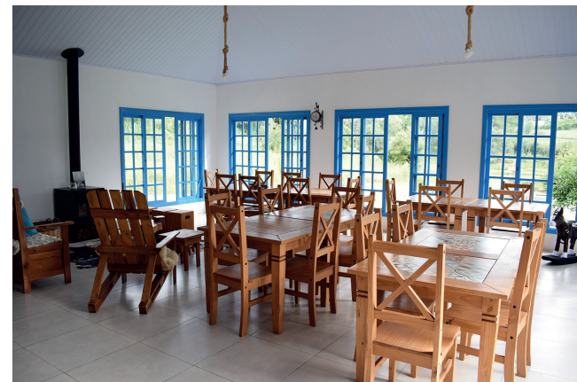
Área do café da manhã e destinada a eventos