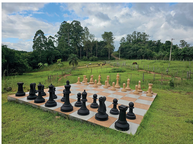
Jogo de Xadrez em tamanho grande