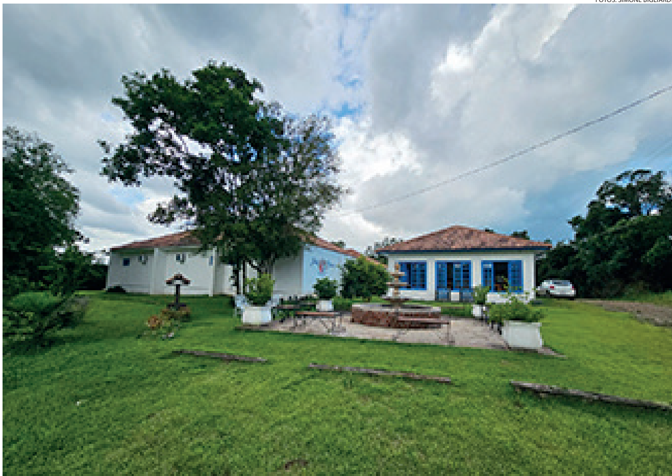
Pala Sierra Hotel Fazenda oferece conforto e momentos únicos em meio a uma bela fazenda em Guaporé

Na parte externa tem um açude onde o hóspede pode praticar a pesca esportiva, um balanço enorme que rende belas fotos, um jogo de xadrez humano que chama muito a atenção no jardim, opção de passeios ciclísticos com a cedência da bicicleta. Todas essas atividades e mais o café da manhã colonial estão inclusos no pacote de hospedagem. À parte é possível fazer passeios guiados a cavalo. E também se deliciar com os almoços e jantares preparados com todo o sabor que somente uma verdadeira fazenda pode oferecer.