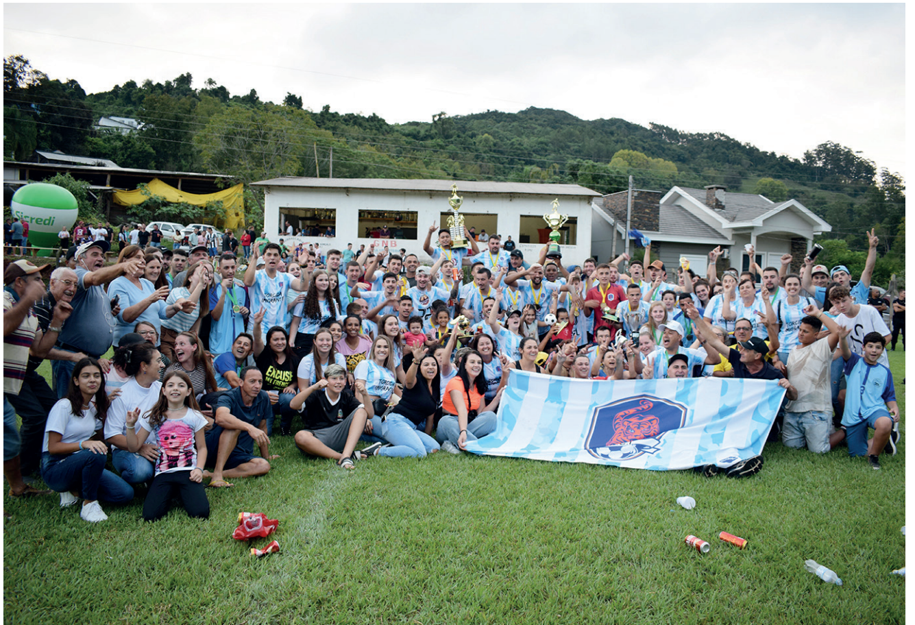
Atual campeão Imigrante, folga na primeira rodada e tem os jogos em seu campo

A primeira rodada será domingo (25) na Linha Tigrinho, o primeiro confronto será Atlético Caçadoreense x Esperança, às 8h pelos aspirantes e às 10h pelos titulares e à tarde Botafogo e Cristal se enfrentam, às 13h30min pelos aspirantes e às 15h30min pelos titulares. A equipe do Imigrante folga na rodada.