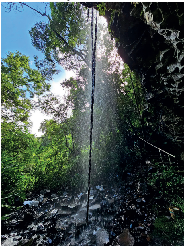
Queda d'água bem ao lado da gruta

particular da família Cacciamani, mas está com acesso sempre aberto aos fiéis e devotos de Nossa Senhora Aparecida.