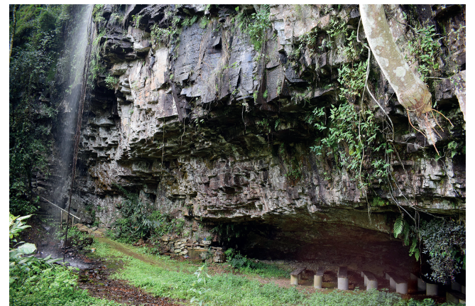
Escadaria chega ao lado da queda d'água