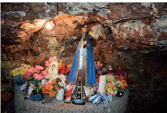
Imagem de Nossa Senhora Aparecida