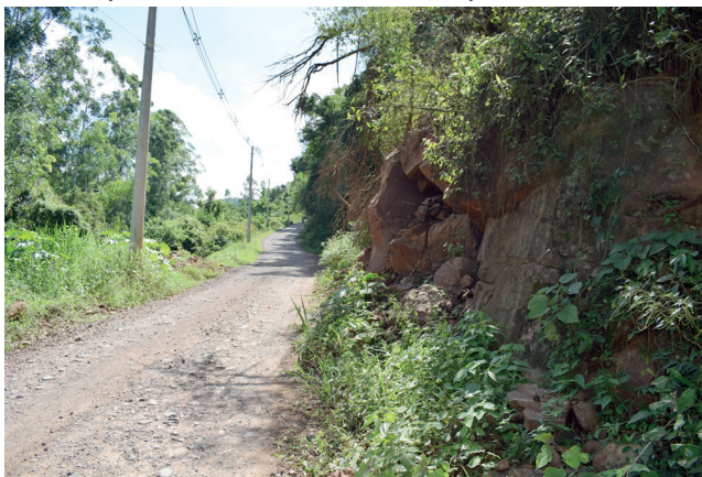
São Luiz qualquer momento a encosta pode desmoronar