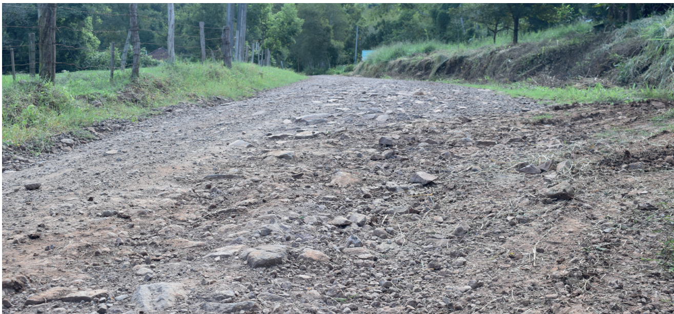
Estradas do interior ou estão com buracos ou puro pedras como na Linha Auxiliadora