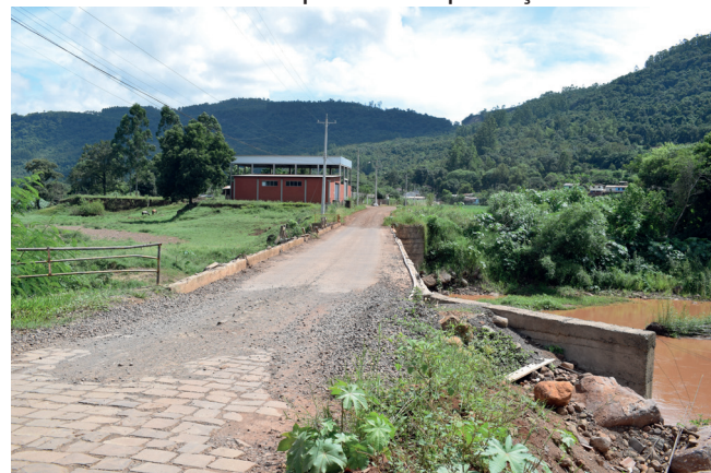
Ponte do Jacarezinho sem proteção lateral