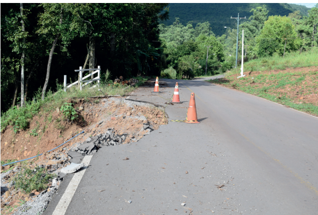
São Roque desmoronamento está próximo a casas