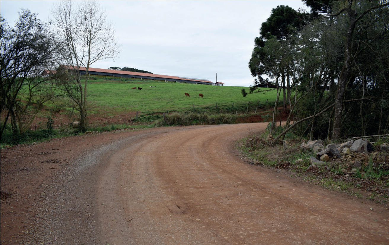
Estradas de chão recebem manutenção constante e em diversos pontos o Município faz o alarmamento da via para melhor escoar a produção e chegar os insumos aos produtores

A cada ano a estiagem vem afetando mais a agricultura. Pensando em atender essa importante demanda, o Município solicitou a análise de diversos poços que estavam perfurados, mas que não tinham laudo de qualidade da água. Com os laudos confirmando que a água