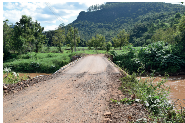
Ponte da Barra do Coqueiro sem proteção lateral