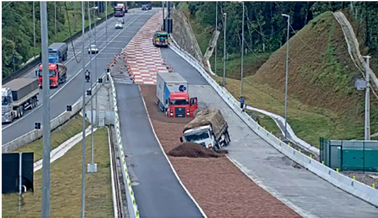
Projeto de áreas de escape nas rodovias gaúchas busca diminuir os acidentes fatais no trânsito

O projeto que visa desacelerar automóveis utilizando rampas em áreas de escape nas rodovias gaúchas foi aprovado, na terça-feira (20), por unanimidade, na Assembleia Legislativa. O autor da medida, deputado estadual Guilherme Pasin, diz que o número de acidentes, inclusive fatais, nas estradas foi a motivação da proposta. “Queremos acabar com as mortes consideradas evitáveis no trânsito. Para isso, sugerimos a criação dessas áreas em declives acentuados, como na Serra. Essa estrutura reduz consideravelmente a velocidade dos veículos em trechos em que principalmente caminhões perdem os freios e ocasionam graves acidentes, inclusive fatais”, explica. De acordo com o deputado, a medida foi proposta a partir de estudos prévios, uma vez que a instalação deve ser feita em áreas específicas, onde há grande quantidade de acidentes por tombamentos e colisões. “A partir de apontamentos e indicadores técnicos, os locais adequados vão receber a estrutura, seja por força do Estado, convênios, concessões ou projetos”.