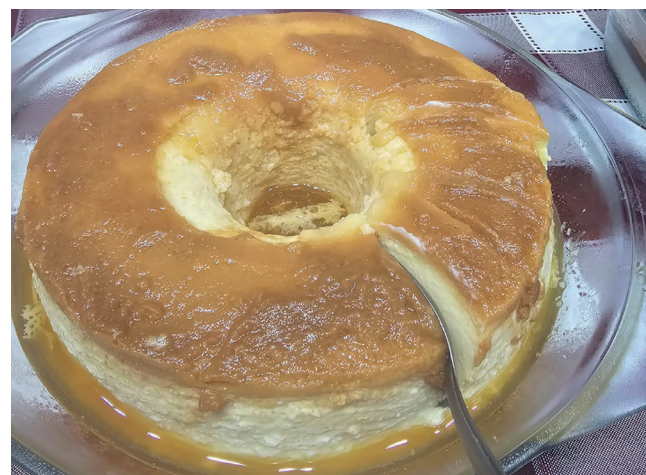
Pudim de leite e muitas outras delícias de sobremesa