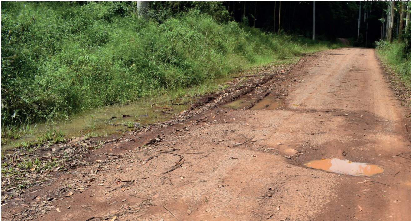
Linha Chiquinha buracos e valetas que não escoam a água, além de danificar estrada tem perigo de dengue

"Aqui em São Roque e Barra do Coqueiro temos vários trechos do asfalto que desmoronaram ainda na cheia e não foi feito nada, só colocado cones. A cabeceira da ponte foi levada pela água e ainda está sem proteção. As estradas de chão estão viradas em buracos e pedras é um fiasco as condições de trânsito que temos no interior de Encantado ".