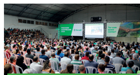
12/03 - NOVA BRÉSCIA