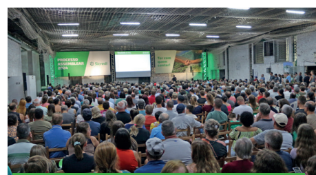
09/04 - ROCA SALES