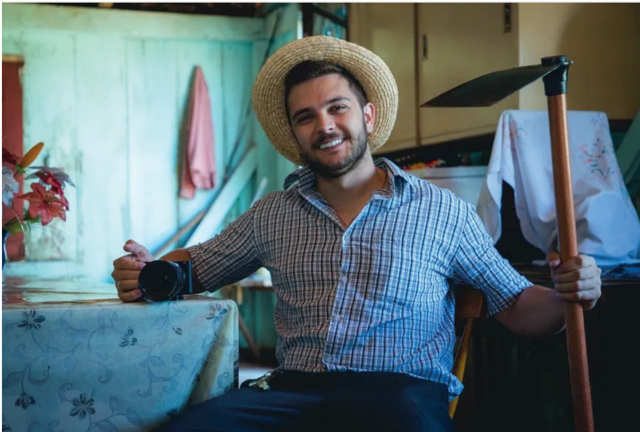
Show do Badin às 14h no Salão Paroquial. À noite, no Ginásio, Pérola Negra, Tchê Barbaridade e Caio e Gabriel

A realização do evento é da Prefeitura de Coqueiro Baixo.