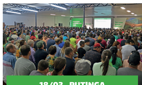
18/03 - PUTINGA