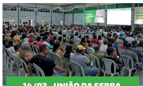
14/03 - UNIÃO DA SERRA