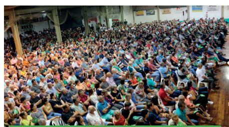
08/04 - ENCANTADO