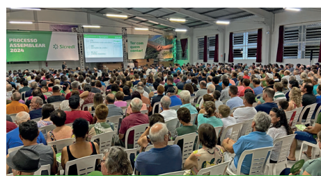
20/03 - DOIS LAJEADOS