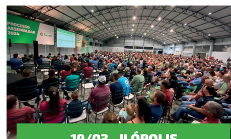
19/03 - ILÓPOLIS