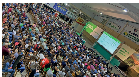
21/03 - GUAPORÉ