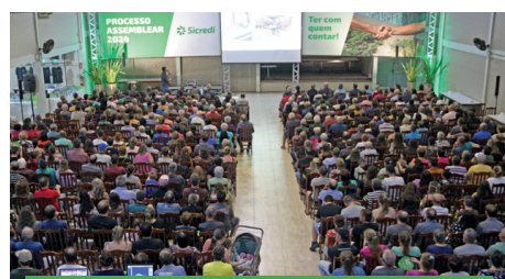
10/04 - MUÇUM