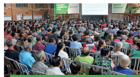
03/04 - CAPITÃO