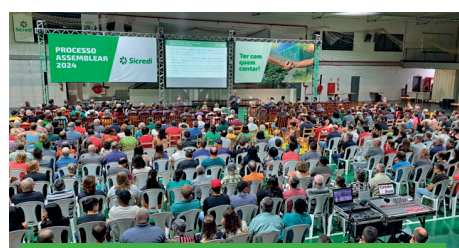
11/03 - COQUEIRO BAIXO