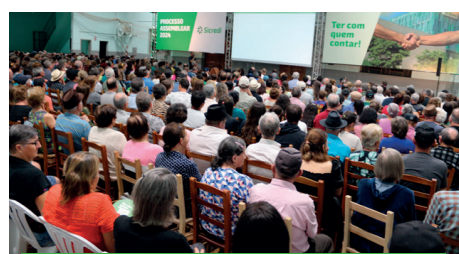
25/03 - RELVADO