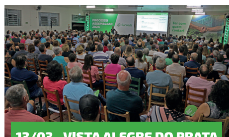
13/03 - VISTA ALEGRE DO PRATA

Cerca de 16 mil pessoas estiveram presentes nas assembleias de núcleo realizadas de 11 de março a 10 de abril.