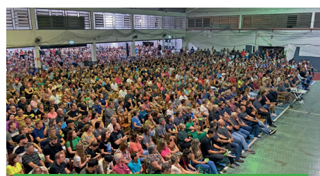
04/04 - ARROIO DO MEIO