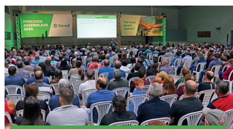
02/04 - SÃO VALENTIM DO SUL