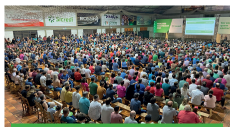
27/03 - ANTA GORDA