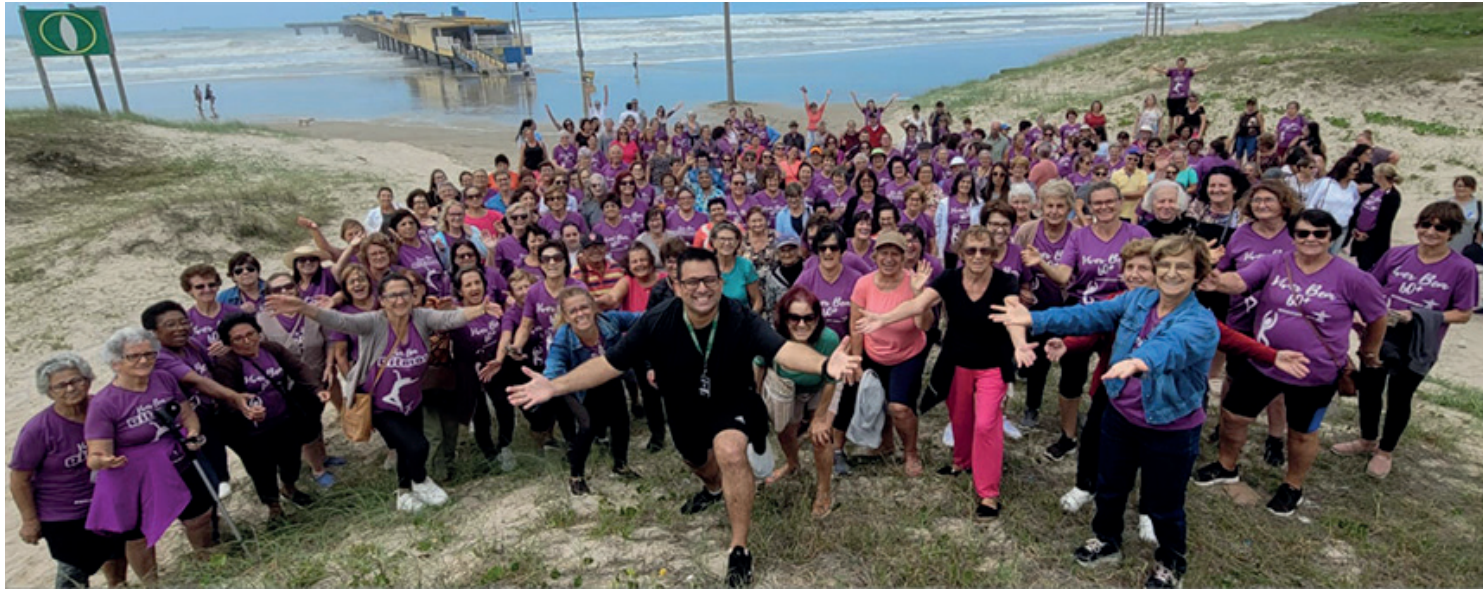
Grupos de onze municípios são esperados em Encantado

O encontro espera atrair representantes de 11 municípios da região, com o objetivo de fomentar a prática de atividades físicas através da dança e música, criando um ambiente dinâmico e inclusivo para a terceira idade. Durante o evento, haverá a entrega do prêmio "Amigo da Pessoa Idosa" para as prefeituras que se destacaram no desenvolvimento de políticas públicas para a terceira idade. A premiação é uma iniciativa da Federação Internacional de Educação Física e Esportiva