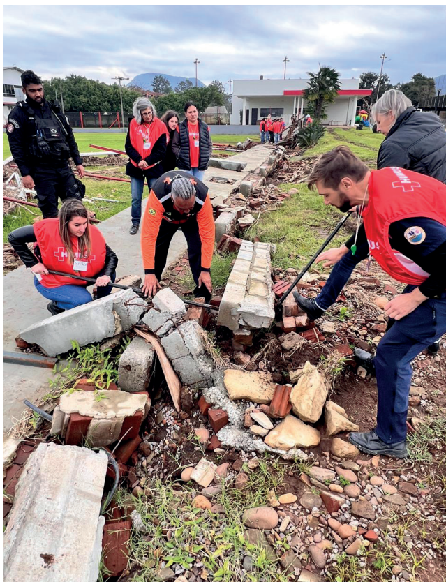
Capacitação em Roca Sales