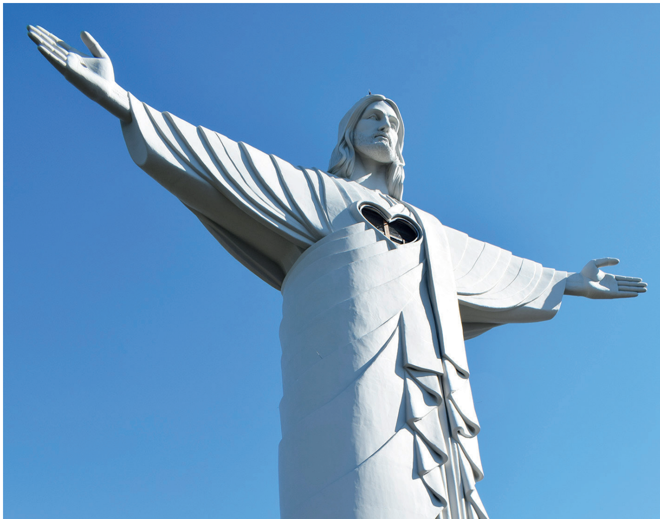
Cristo Protetor   um dos principais atrativos da regi o

Somente em Encantado, conforme dados divulgados pela  rea de turismo, 32 empreendimentos foram afetados pelos eventos clim ticos de maio, e mais de 300 pessoas vivem da atividade na cidade. Se for contabilizar regionalmente esse n mero aumenta consideravelmente, s o in meras fam lias que tem no turismo seu ganha p o. Por isso a a  o,   muito importante para o setor e para a economia de todo o Vale do Taquari, inclusive do setor de servi os.