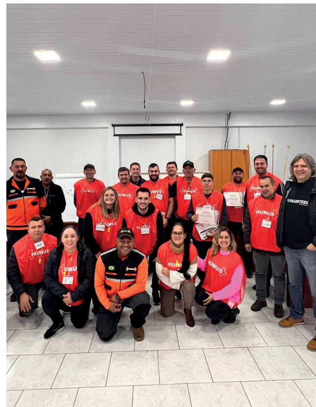
e em Muçum