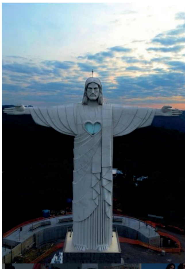
Cristo Protetor de Encantado

da  st tua do Cristo foi iniciada em 2019 e concl da no final de abril de 2022. A visita  o pode ser feita aos s bados, domingos e feriados. Os visitantes podem acessar todo entorno do Cristo,