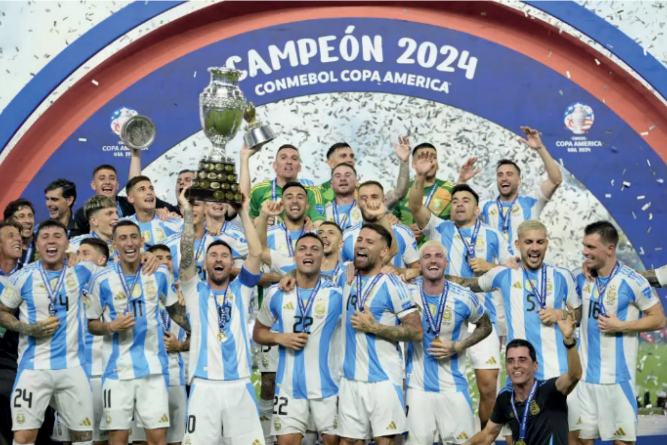
Com Grupo mais qualificado, Seleção Argentina vence a Colômbia na prorrogação por 1 a 0 e fica com o título da Copa América 2024

Na noite do domingo (14), no Hard Rock Stadium, em Miami, a seleção Argentina venceu a Colômbia na prorrogação por 1 a 0, e se tornou a maior vencedora da competição continental. O jogo teve um atraso de uma hora e meia. No primeiro tempo a Colômbia foi superior e criou mais oportunidades. Córdoba acertou a trave de Dibu Martínez na melhor chance de gol dos colombianos. Já na segunda etapa, as equipes voltaram para tentar decidir a partida. E a Colômbia seguia melhor, e teve outras duas grandes chances com passe de James Rodríguez, Arias recebeu na área e chutou tirando tinta da trave. E numa cobrança de escanteio Sánchez cabeceou por cima. A partir daí, a Argentina começou jogar. A primeira chance foi em um chute cruzado de Di Maria que parou na grande defesa de Vargas. Aos 20 minutos Messi sentiu e teve que ser substituído. Pouco depois a Argentina teve um gol anulado por impedimento, no gol de Nico Gonzáles. No final do segundo tempo a Argentina quase marcou de cabeça com Nico González. Ambas as equipes estavam cansadas e fizeram diversas substituições, a diferença de grupo prevaleceu na prorrogação. A Argentina mesmo com a entrada dos reservas conseguiu manter um bom ritmo de jogo, enquanto a Colômbia, não conseguia mais ficar com a bola.