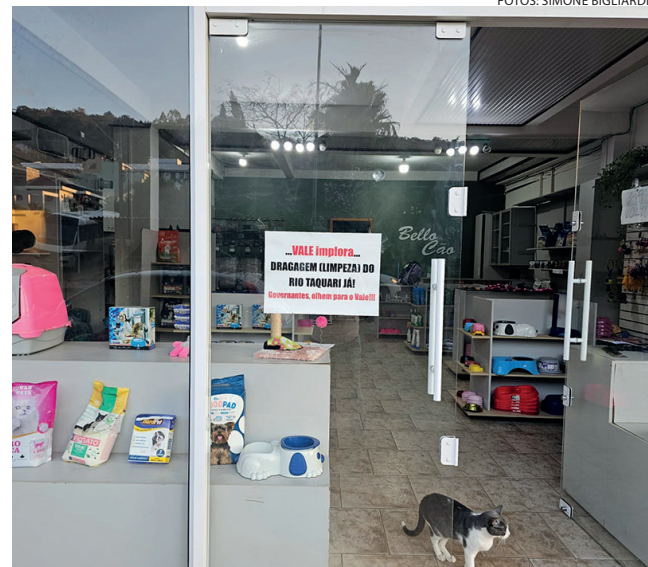
Centenas de cartazes estão colados nas fachadas de comércio e casas de Muçum e municípios do Vale