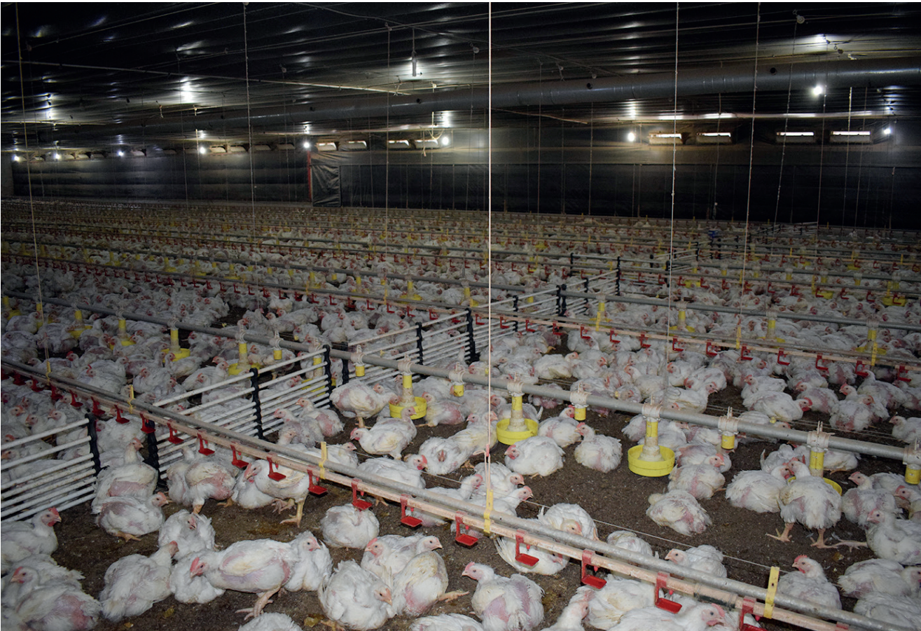
Eliminação e destruição de todas as aves e limpeza e desinfecção do local foram realizadas para conter o foco

De acordo com o MAPA, uma investigação complementar será conduzida em um raio