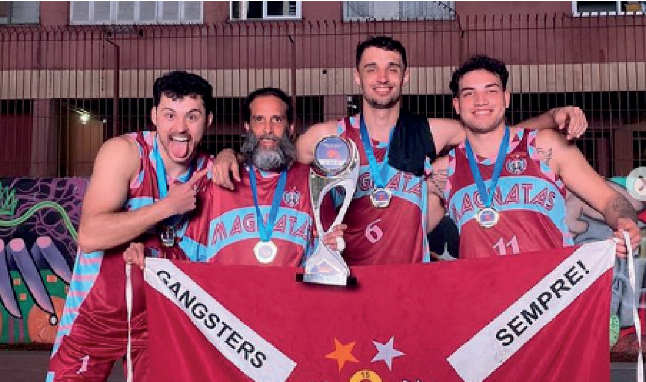
Magnatas da Bola vai em busca do Bicampeonato Gaúcho de Basquete 3x3

O Magnatas da Bola de Encantado vai a Porto Alegre no domingo (1º) com três equipes para a disputa do Campeonato de Gaúcho de Basquete 3x3. A competição que será realizada no Dunk Park é etapa seletiva para o Brasileiro. O Maganatas da Bola disputará a vaga com duas equipes na categoria adulta e uma na categoria Sub 23, os jogos iniciam às 9h e se estendem até às 18h. Os vencedores de cada categoria garantem vaga no Sul Brasileiro de Basquete 3x3. A equipe encanta-