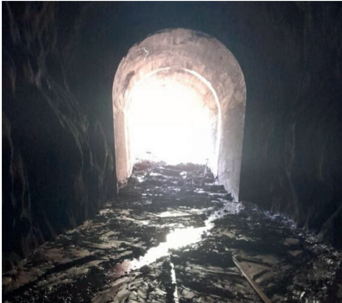
Ferrovias do Trigo foi uma das mais atingidas pelos deslizamentos e enchente

A enchente deixou um impacto severo na malha ferroviária do Estado. Em levantamento realizado recentemente estima-se que o custo para recuperar as ferrovias bloqueadas poderá ultrapassar R$ 3 bilhões. Aproximadamente 800 dos 1.700 quilômetros da malha ferroviária precisam de intervenção, e até cinco pontes e viadutos tem que ser reconstruídos. As regiões mais afetadas são o Vale do Taquari, Serra e o Vale do Rio Pardo. Atualmente, não é possível transportar carga por trem do Rio Grande do Sul até Santa Catarina devido ao estado das vias. A concessão da Rumo Logística, responsável pela administração do trecho, está prevista para terminar em fevereiro de 2027. Caso a empresa faça o investimento para a recuperação, será necessário ressarcimento. Isso pode implicar na prorrogação do contrato ou em um repasse financeiro pelo governo federal. A discussão com a Agência Nacional dos Transportes Terrestres (ANTT) gira em torno da viabilidade de reconstruir linhas subutilizadas, algumas das quais foram construídas há mais de 100 anos. A alternativa considerada é a construção de novos traçados mais economicamente viáveis.