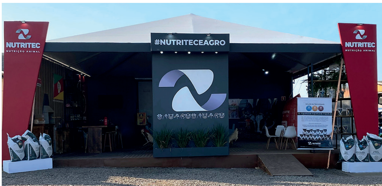
Estande da Nutritec na Maior feira do Agronegócio da América Latina

ção NutriCorte, desenvolvida especialmente para bovinos de corte. Com uma composição inovadora e formulada a partir de ingredientes nobres, a NutriCorte se destaca pela sua alta qualidade nutricional, contendo 14% de proteína bruta. A ração foi elaborada para otimizar o desempenho dos bovinos, garantindo ganhos expressivos na produtividade (ganho de peso e conversão alimentar), potencializando assim um maior retorno econômico aos pecuaristas.