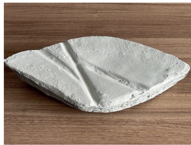
Fragmento da mão direita do Cristo Protetor