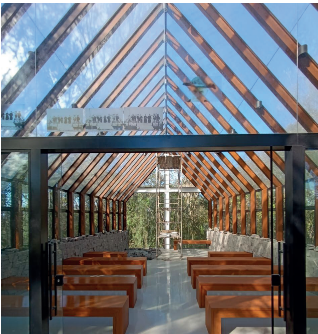
Capela Monsenhor Scalabrini