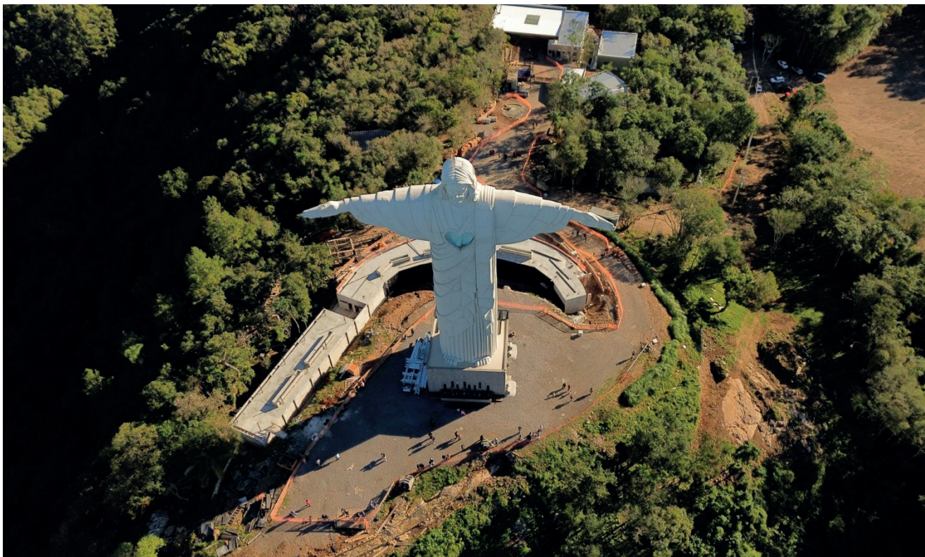
Foto área Complexo do Cristo Protetor