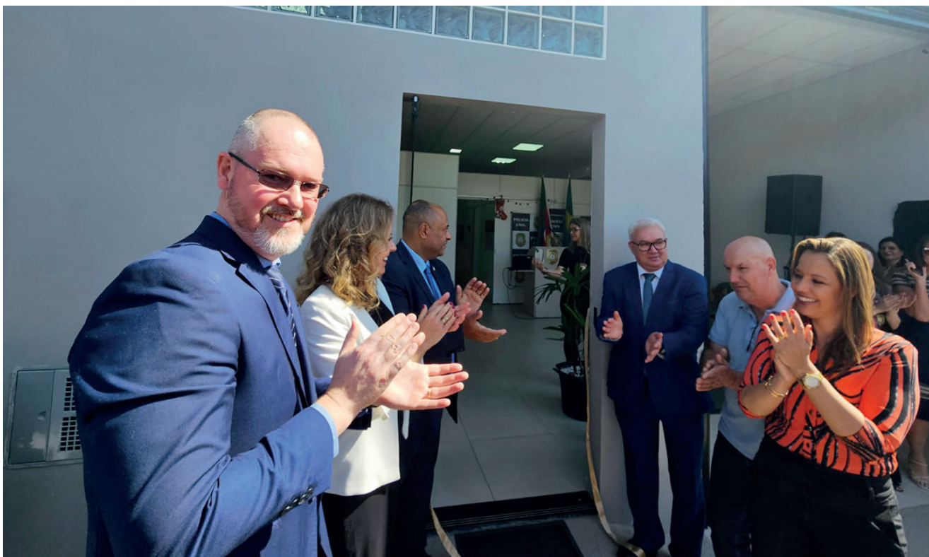
Corte da fita com as autoridades