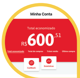
Cashback (MENU CONTA > CASHBACK)