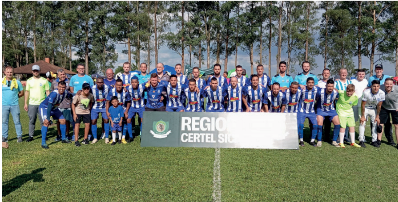
Juventude de Guaporé conquista o título inédito na categoria titulares do Regional Aslivata