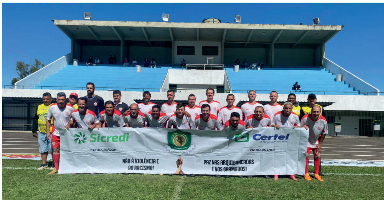
Serrano de Jacarezinho categoria veterano está na final da Copa Certel Sicredi Regional Aslivata

O Serrano de Jacarezinho, Encantado foi até Venâncio Aires enfrentar a Assespe com a vantagem de jogar pelo empate, pois havia vencido a primeira partida por 4 a 0. O jogo terminou em 1 a 1, e agora o Serrano decide o título com o São Luiz de Venâncio Aires. A primeira partida da grande final, é nesde domingo (8) às 9h45min no Estádio das Cabriúvas em Encantado. O jogo da volta será em Venâncio Aires, no dia 15 de dezembro.