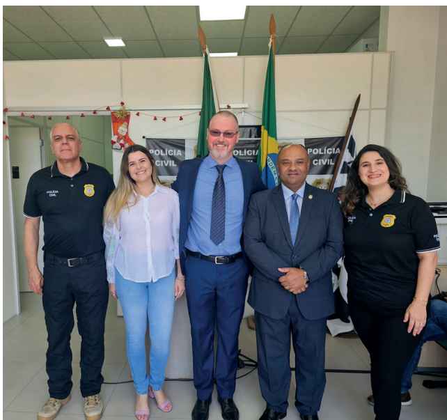
Equipe da DP de Roca Sales com o Chefe de Polícia do RS Fernando Sodré