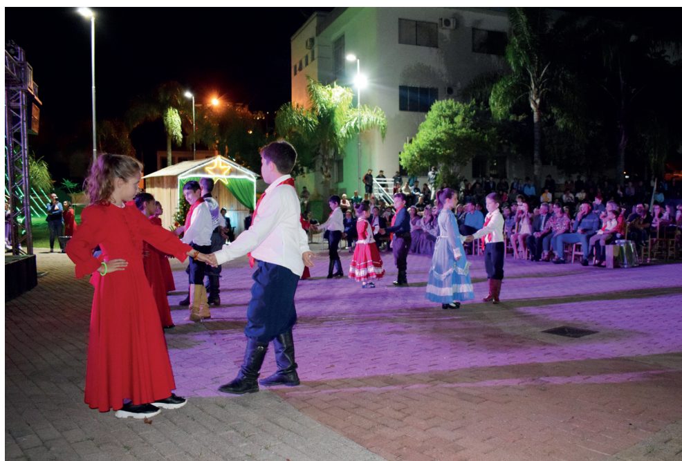
dançando cultivando as tradições