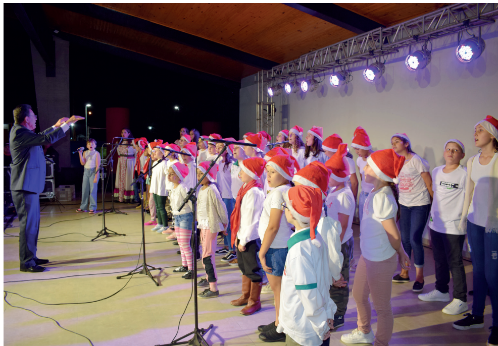
Apresentações de jovens talentos locais cantando e ...

"Estamos preparando um grande Fim de Ano na Praça e esperamos que todos os coqueirenses participem e também que venham visitantes das nossas cidades vizinhas. Esse é um evento que busca trazer alegria, enfatizar essa data tão importante do Natal e Fim de Ano e também de promover uma integração entre todos. Mesmo com um ano desafiador devemos comemorar e seguir trabalhando."