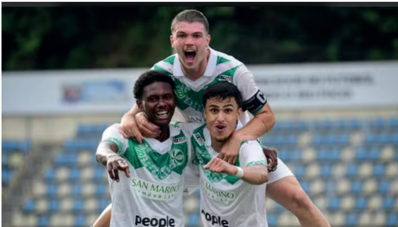
Jogadores do Juventude comemorando gol

perdeu os dois primeiros jogos e não soma nenhum ponto no Grupo 29. O São José de Porto Alegre está no Grupo 08 e se classificou em primeiro com seis pontos, duas vitórias e uma derrota. O Juventude também está classificado, o clube da Serra é o primeiro colocado do Grupo 12, com seis pontos conquistados em duas vitórias e uma derrota. O quarto gaúcho é o Grêmio, que até agora tem 100% de aproveitamento, o Tricolor lidera o Grupo 21 com seis pontos, sendo duas vitórias em dois jogos. O último confronto da fase classificatória para o Grêmio será contra o Atlético Guaringuetá, às 13h do sábado (11).