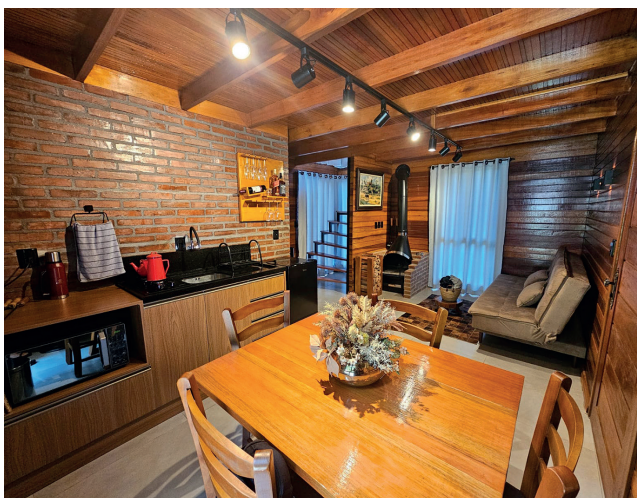
Cabana Mirante tem cozinha e sala integradas