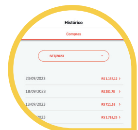
Seu Histórico de Compras