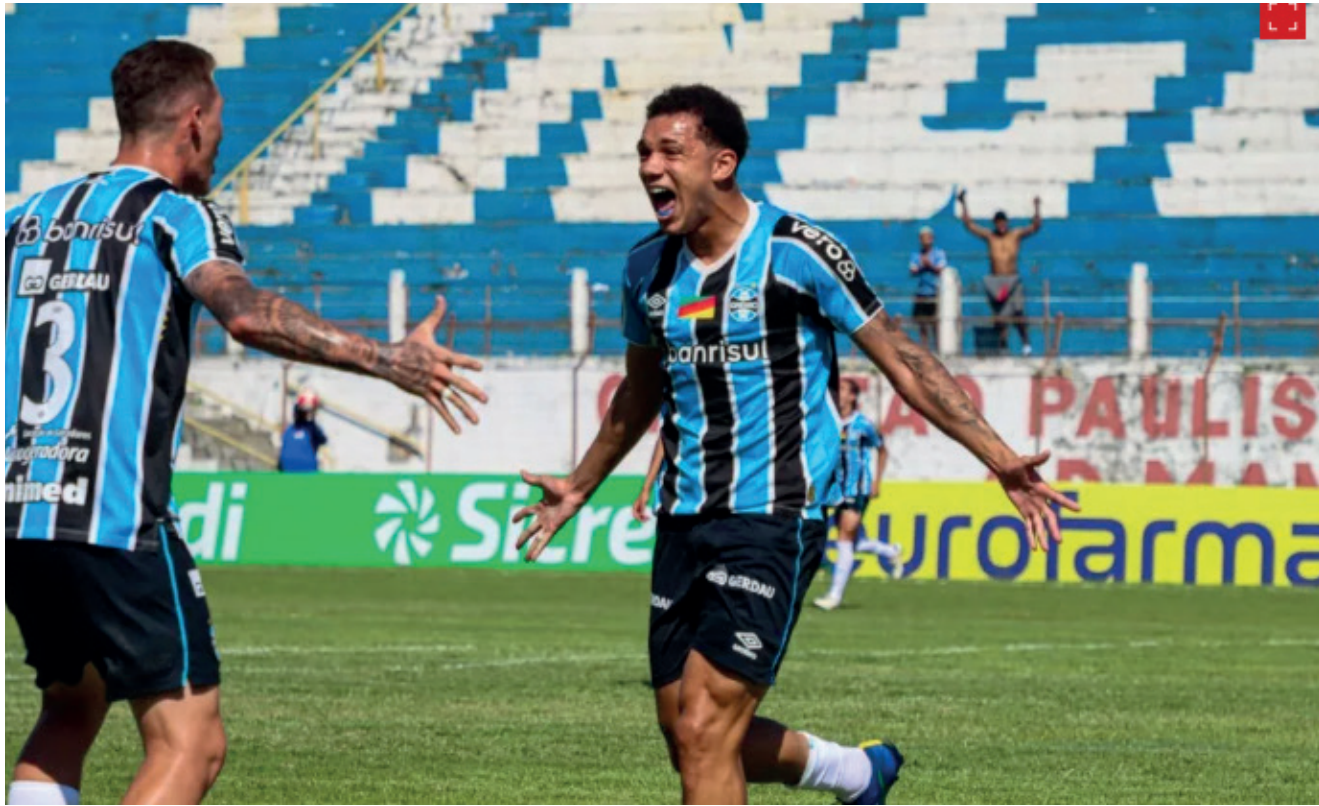
Jogadores do Grêmio comemorando gol

Maior competição de base do futebol brasileiro, a 55ª edição da Copa São Paulo de Futebol Júnior 2025 abriu a temporada no dia 2 de janeiro e se estende até o 25. Ao todo, 128 times disputam a Copinha 2025. As equipes foram divididas em 32 grupos e os dois melhores de cada chave avançam ao mata-mata, que terá seis fases eliminatórias, incluindo a decisão do título. Até o sábado (11) estão sendo disputados os jogos da fase classificatória, no domingo (12) inicia a segunda fase da Copinha. Quatro equipes do Rio Grande do Sul estão participando da competição. O Internacional que já está desclassificado, pois