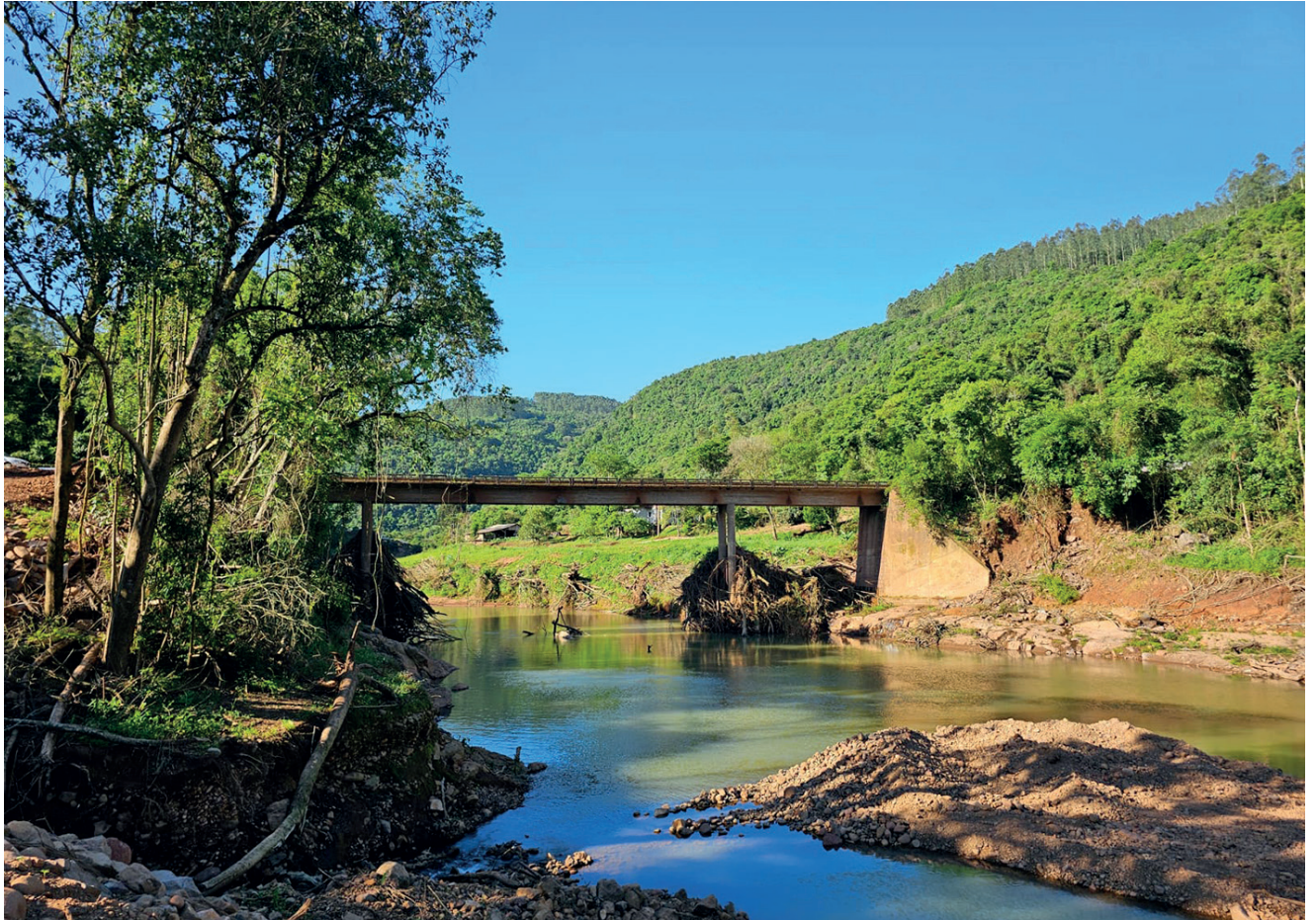
Ponte na divisa de Encantado e Relvado teve queda do pilar central. Logo ao lado uma estiva foi construída pelo Município de Relvado para amenizar problemas de deslocamento.

O grande problema, conforme a Administração Municipal de Relvado, é que essa é a segunda vez da publicação de abertura de contrato para reconstrução da ponte, na primeira vez não houve empresas interessadas.