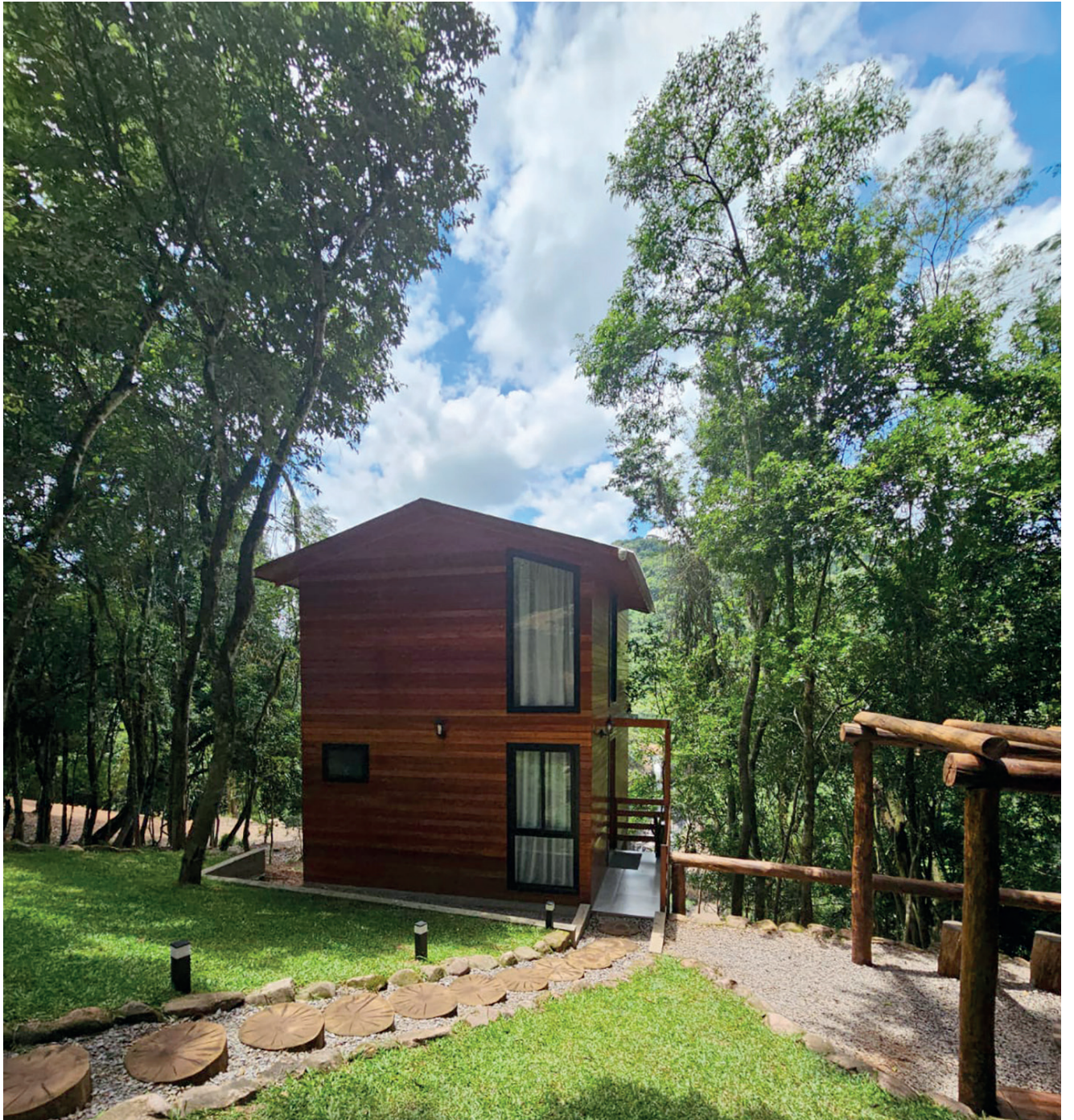
Cabana Mirante da Rasga Diabo está rodeada por uma natureza exuberante

Nos dois pavimentos da cabana tem vista para a bela cascata, e é possível se acalmar ouvindo o barulho da água correndo