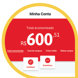
Cashback (MENU CONTA > CASHBACK)