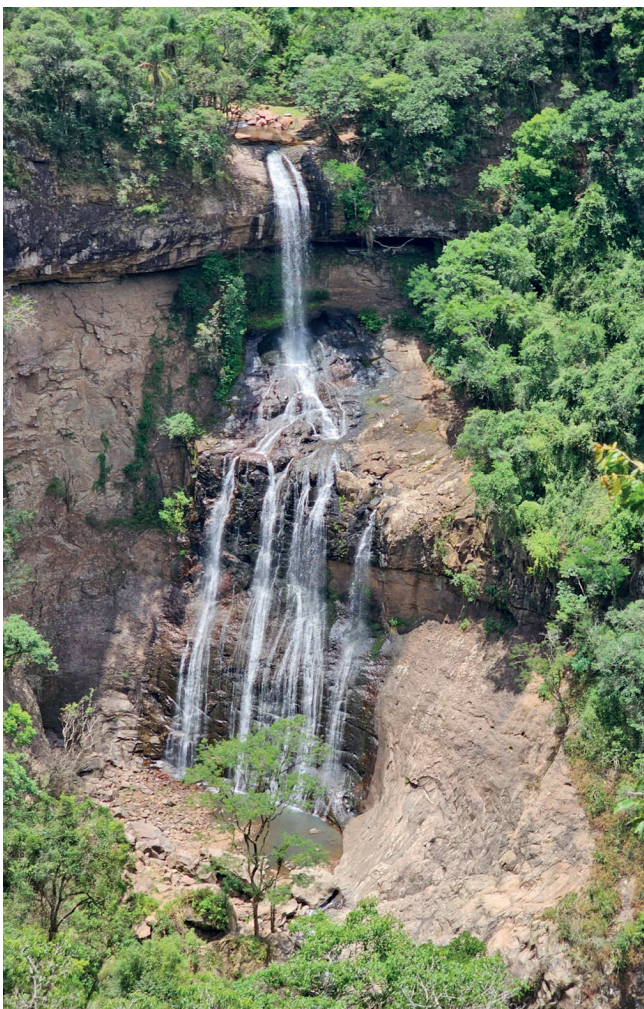
Cascata Rasga Diabo em Vespasiano Corrêa

rante são em torno de R$ 600 e podem ser reservados através do Instagram @cabanamirante ou pelo whatsapp (51) 99186-8803. O café da manhã é a parte, e tem uma infinidade de delícias coloniais, a partir de R$ 25 por hóspede.