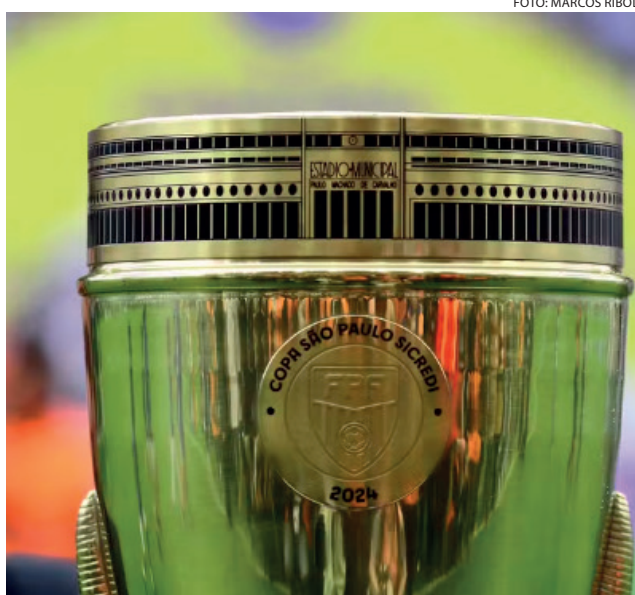
Taça da Copinha

As quartas de final serão nos dias 18 e 19 de janeiro, as semifinais nos dias 21 e 22 e final está marcada para o aniversário da