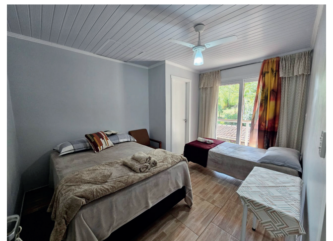
Quartos de casal com cama de solteiro