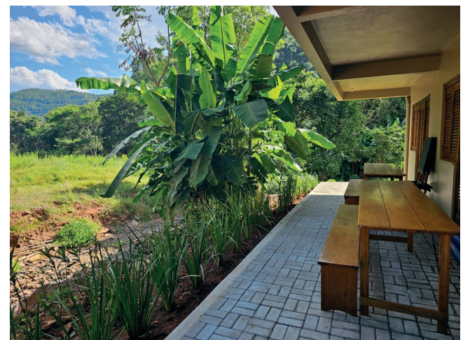
Lugar de contato com a natureza