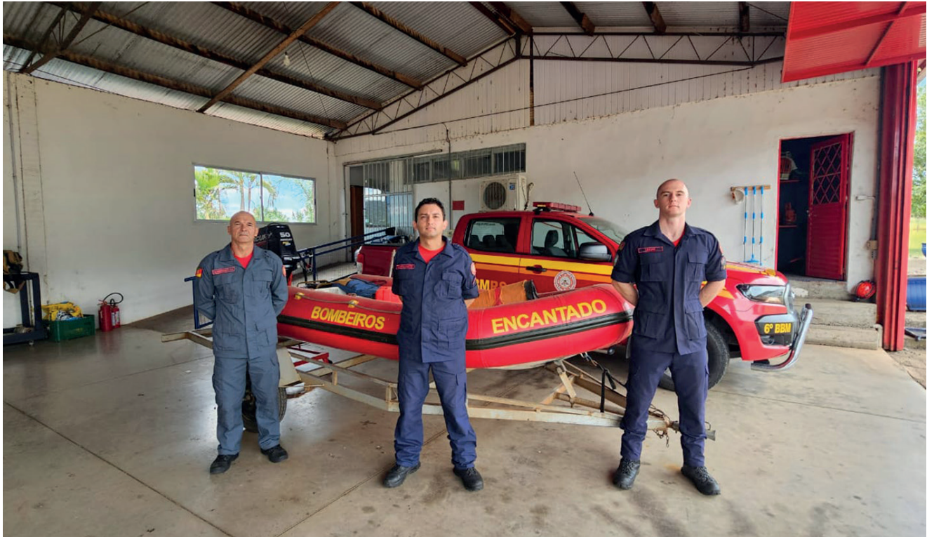
Bombeiros Civis e Militares de Encantado salvaram inúmeras vidas nos desastres climáticos

Entre os dias 29 de abril e 05 de maio de 2024, os 15 bombeiros do quartel de Encantado, trabalharam direto para atender chamados de busca e salvamento de pessoas que foram atingidas pela enchente ou deslizamentos. “No desastre climático de 2024, os nossos 15 bombeiros atenderam mais de 500 ocorrências de busca e salvamento. Dividimos o grupo em três guarnições e cada uma fazia em média 30 atendimentos por dia, totalizando 90 por dia. Com certeza para todos nós esse foi o momento mais desafiador da nossa profissão. Nossa primeira missão é salvar vidas, e com o empenho de todo o grupamento, inclusive de colegas que chegaram a pé, até o quartel, pois não havia mais passagem, conseguimos fazer inúmeros salvamentos. Todos são marcantes, mas fizemos o salvamento de cinco crianças no bairro Jacarezinho em Encantado que estavam cercados