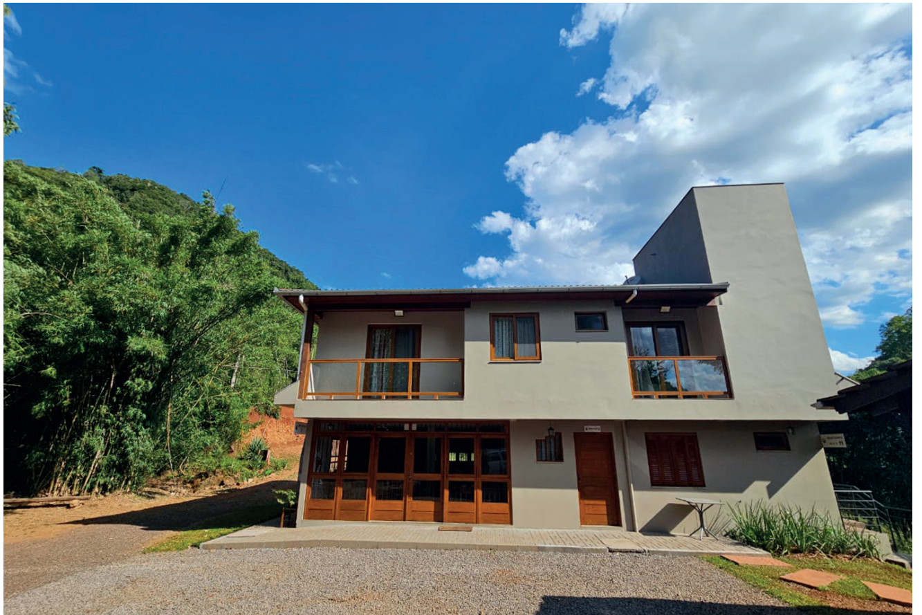
Estalagem Santa Rita tem diversos quartos

A Estalagem oferece em sua diária o café da manhã, podendo também incluir o almoço