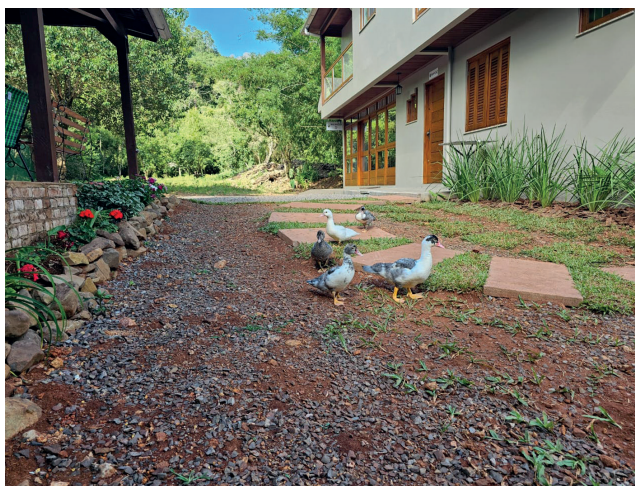
Os patinhos são uma atração a parte