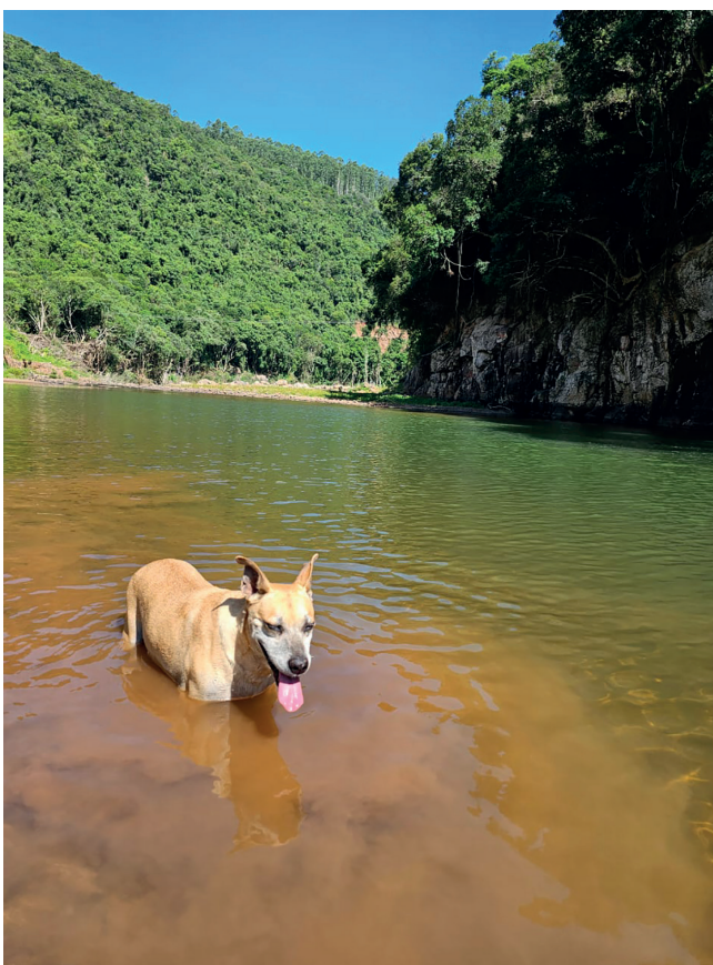
Local com arroio para banhos relaxantes

divisa de Encantado e Relvado, antes da ponte. Para acessar a propriedade é preciso sair do asfalto e dirigir 800 metros por uma estrada de chão. Para mais detalhes entre em contato pelo (51) 99726.5908.