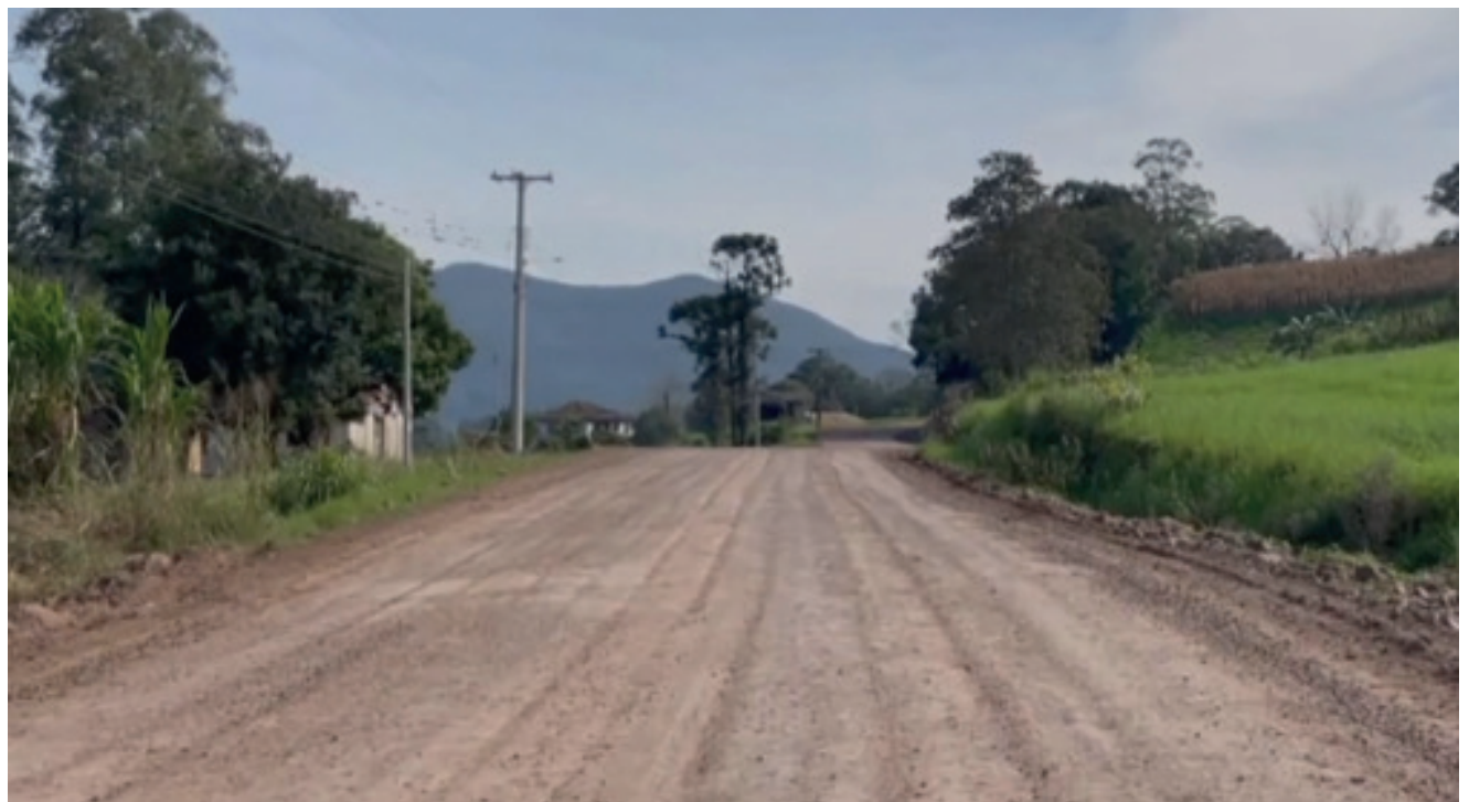
Entre as obras anunciadas pelo Estado está o asfaltamento de 6km da ERS 129 entre Roca Sales e Colinas

Entre as obras, está o tão aguardado asfaltamento entre Roca Sales e Colinas na comunidade de Linha Fazenda Lohmann. O trecho de cerca de seis quilômetros, será construído pela empresa Traçado Engenharia de Erechim, e o prazo para o início dos trabalhos é de 90 dias. Além do asfaltamento, o trecho até Estrela que totaliza 27,3 quilômetros receberá obras de recuperação de pavimentação, contenção, recuperação e reforço de cabeceiras e pontes. O investimento será de R$ 55,9 milhões. A obra deverá ser concluída em até 18 meses. Já nos 92 quilômetros da ERS 332 o investimento será de R$ 200,4 milhões com prazo de entrega de 24 meses. Neste trecho