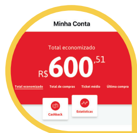
Cashback (MENU CONTA > CASHBACK)