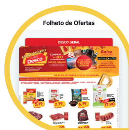
Todas Nossas Ofertas