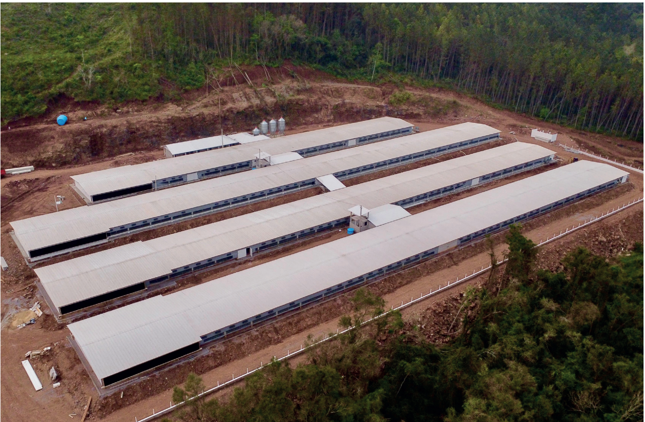
Investimento é de R$ 11 milhões