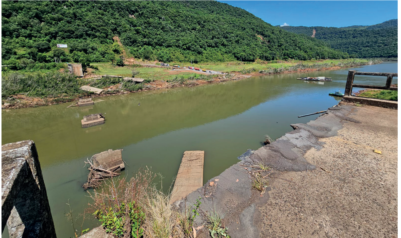
Ponte sobre o Rio Taquari entre São Valentim do Sul e Santa Tereza caiu em setembro de 2023