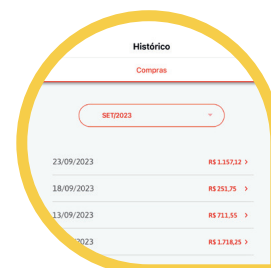
Seu Histórico de Compras