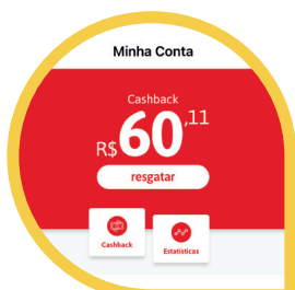
Sua Economia Usando Clube Desco (MENU CONTA > ESTATÍSTICAS)