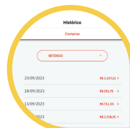
Seu Histórico de Compras