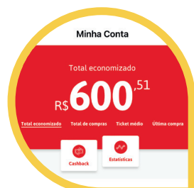
Cashback (MENU CONTA > CASHBACK)