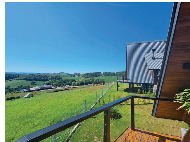
Vista do horizonte da varanda do Chalés