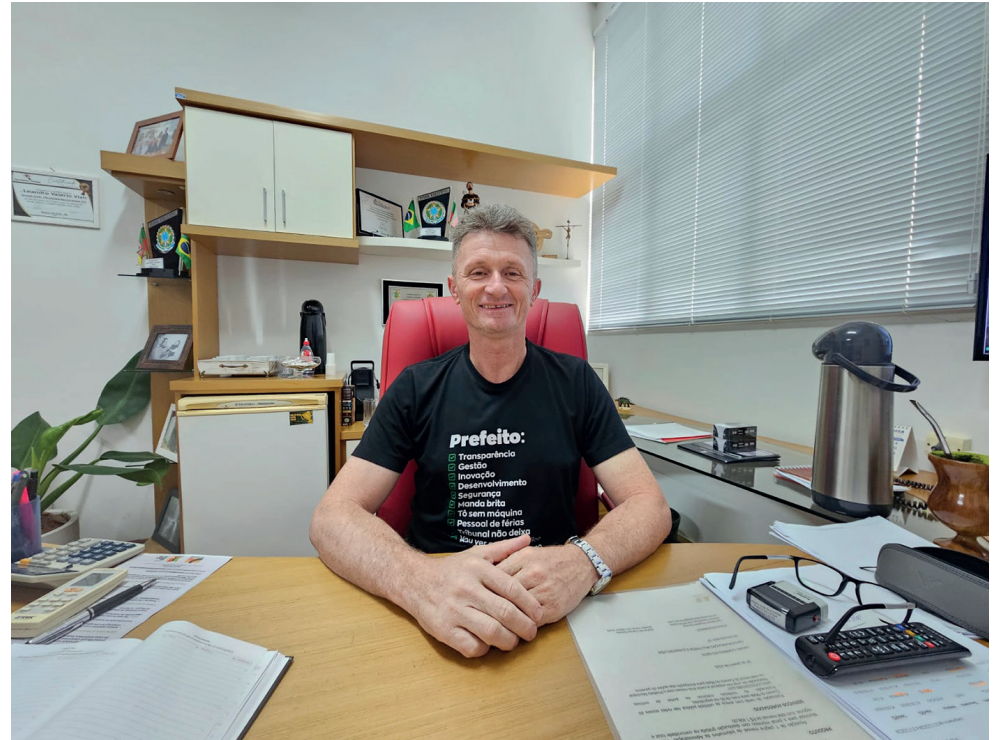
Prefeito de Doutor Ricardo Alvaro José Giacobbo

Com relação as enchentes, o município foi contemplado com R$ 1,5 milhão em horas máquinas do Programa Desassorear RS. “O projeto que enviamos foi da limpeza do Rio Zeferino, mas não sei se o valor do Estado irá contemplar todo o desassoreamento que precisa ser feito, caso falte o município fará o aporte financeiro para finalizar o projeto. Além disso, estamos aguardando a Defesa Civil Nacional liberar a primeira parcela, para dar início as obras de reconstrução de pontes. Em Doutor Ricardo foram oito pontes, cinco menores e três maiores que terão que ser reconstruídas. O Governo Federal já empenhou e a empresa vencedora da licitação, assim que receber a primeira parcela já inicia a reconstrução da