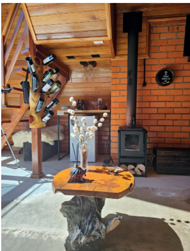
Espaço com lareira