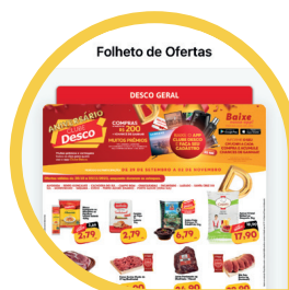
Todas Nossas Ofertas