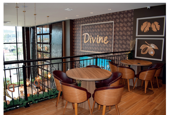
E também fizeram compras na Divine Chocolates