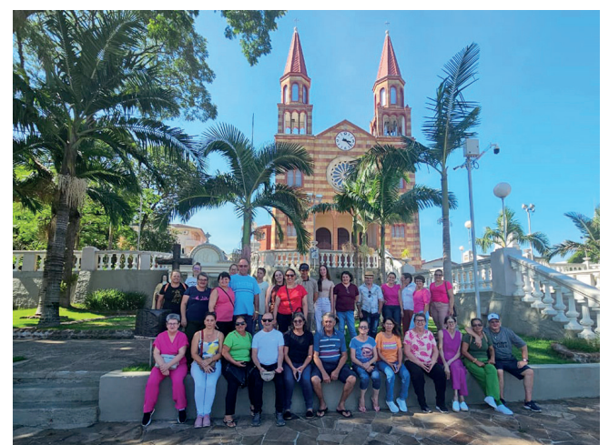
E a Igreja Matriz São Pedro