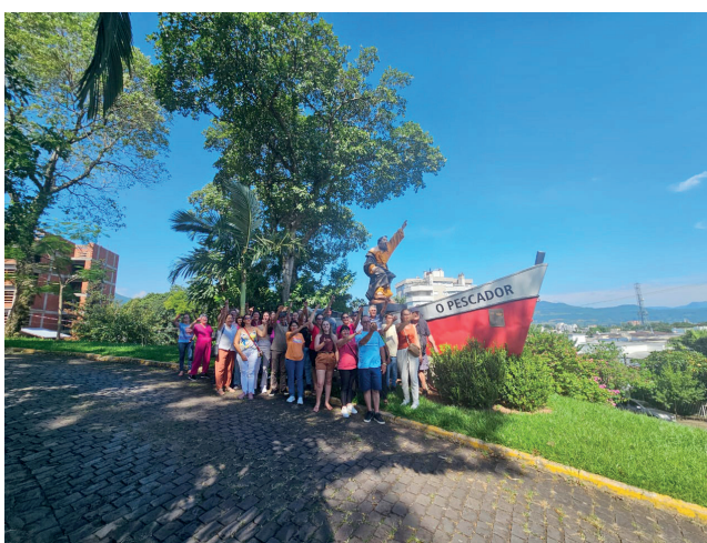
O monumento ao Pescador, São Pedro