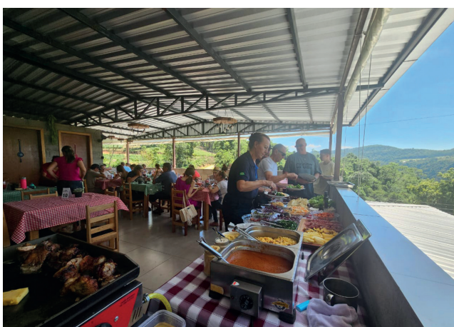
O almoço foi tipicamente italiano na Casa Slaifer