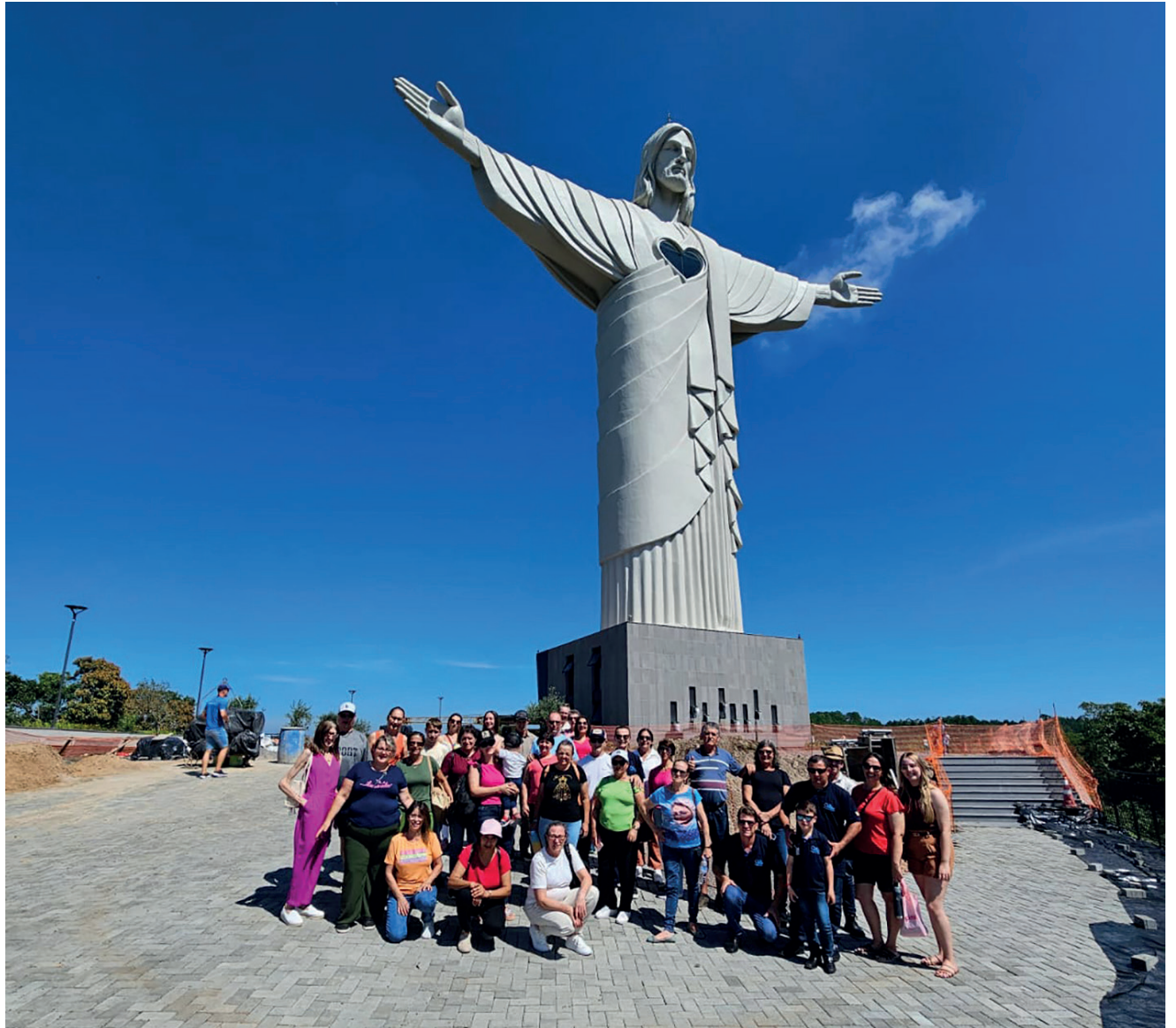
O Grupo conheceu o Cristo Protetor de Encantado

No último sábado (22) conduzimos um grupo do Norte do Estado, das cidades de Sarandi, Ronda Alta e Não-Me-Toque. Mais de trinta pessoas fizeram o passeio por alguns dos atrativos de Encantado. O Cristo Protetor foi o primeiro local a ser apresentado aos turistas que ficaram encantados com a belíssima obra e pretendem voltar ao nosso município após a inauguração para chegar até o coração do Cristo. No Complexo também rezaram na Igreja Monsenhor Scalabrini e fizeram imagens do pedaço da palma da mão do Cristo Protetor que foi abençoado pelo Papa Francisco. Na sequência, conduzimos o grupo até a Lagoa da Garibaldi e explicamos a importância que o local tinha ainda quando fornecia energia para Encantado, e que após a desativação, passou a ser um dos principais pontos turísticos da cidade. O almoço, foi servido na Casa Slaifer na Linha Divertida, interior de Encantado. A comida caseira de verdade, com sabor italiano, conquistou todos os paladares. Ali também os visitantes puderam degustar os licores produzidos pela família e aproveitaram para comprar as compotas, chimias e licores da Agroindústria Slaifer. À tarde, o grupo conheceu a Igreja Matriz São Pedro, o monumento ao Pescador, e também o painel em homenagem aos imigrantes. O passeio encerrou com a visita na Divine, onde os visitantes degustaram e compraram o delicioso chocolate. E também aproveitaram o espaço para relaxar antes de retornar para suas cidades.