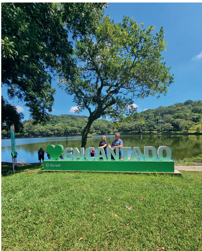
Visitou a Lagoa da Garibaldi