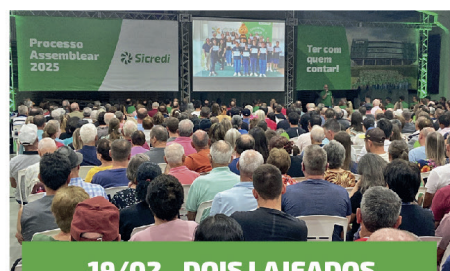
19/02 - DOIS LAJEADOS