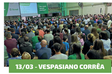
13/03 - VESPASIANO CORRÊA