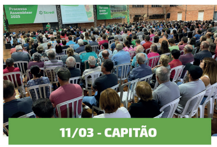
11/03 - CAPITÃO