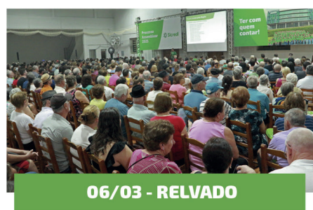
06/03 - RELVADO