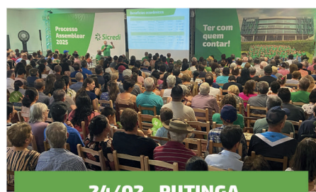
24/02 - PUTINGA