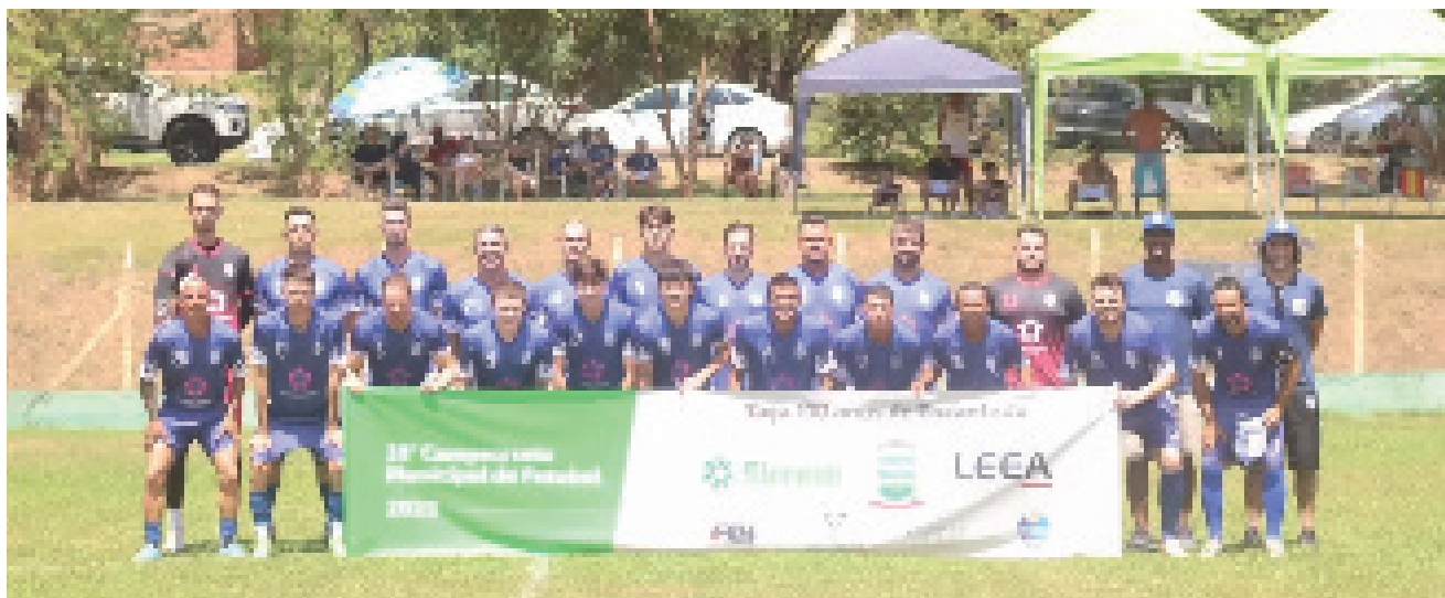
Juventude do Lambari tem 8 pontos e está em quarto na classificação