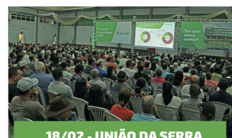
18/02 - UNIÃO DA SERRA