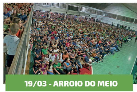
19/03 - ARROIO DO MEIO