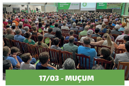
17/03 - MUÇUM