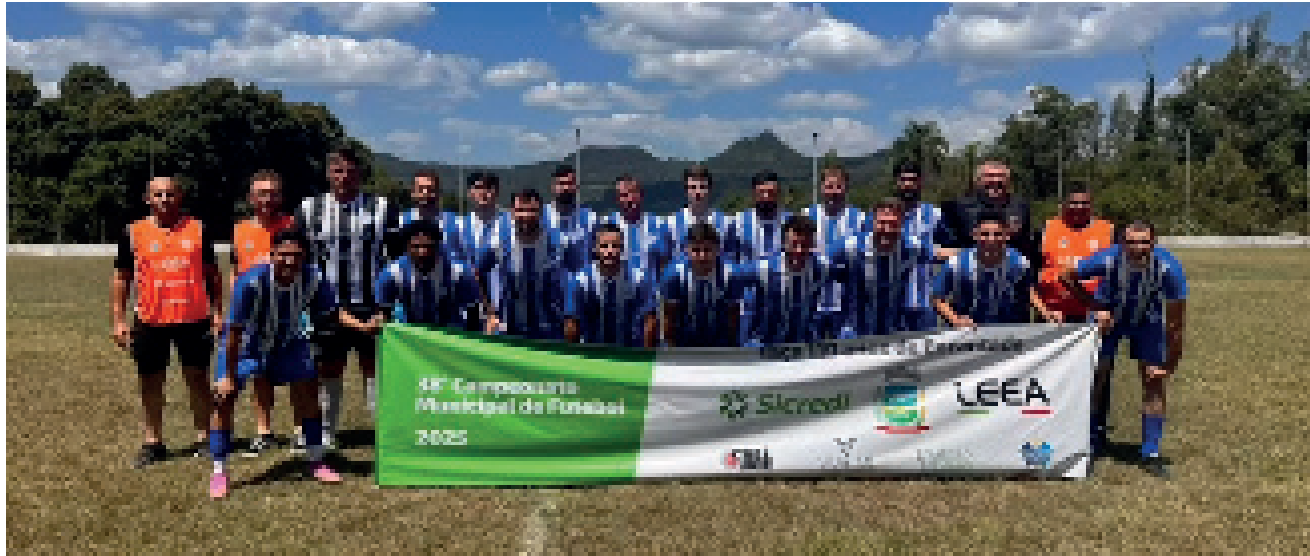
Guarani da Linha Argora lidera o Municipal de Encantado com 13 pontos