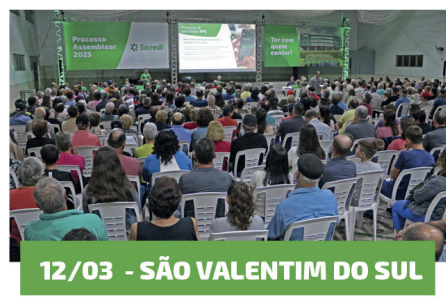
12/03 - SÃO VALENTIM DO SUL