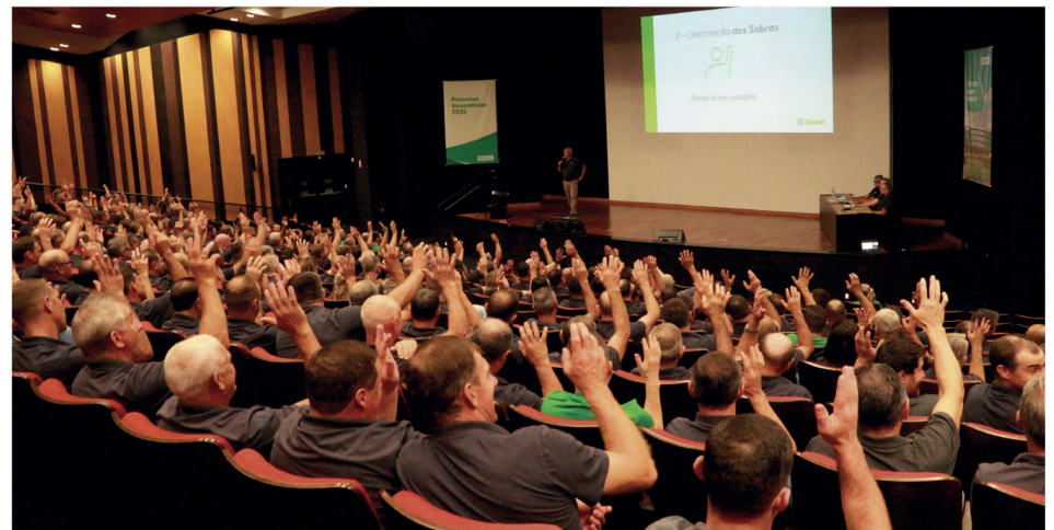
A Assembleia Geral Extraordinária e Ordinária ocorreu na última sexta-feira, dia 21 de março, na Sede do Sicredi Região dos Vales.

A Assembleia Geral Extraordinária e Ordinária ocorreu na última sexta-feira, dia 21 de março, no Auditório da Sede da Cooperativa, em Encantado. Na oportunidade, os delegados, que são representantes dos associados, deliberaram entre outros assuntos sobre: prestação de contas, destinação das sobras, eleição do Conselho de Administração e reforma estatutária.