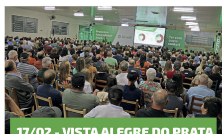
17/02 - VISTA ALEGRE DO PRATA