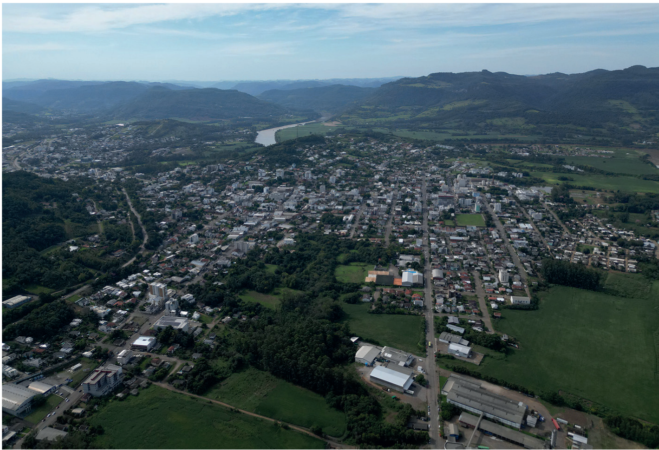
Município de Encantado comemora 110 anos na segunda-feira dia 31 de março

Todos os eventos têm entrada franca e estacionamento gratuito.