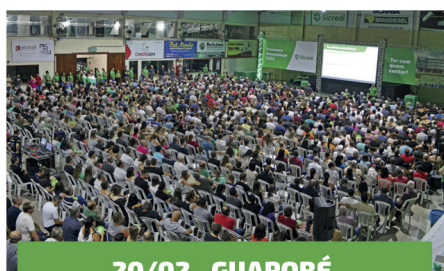
20/02 - GUAPORÉ