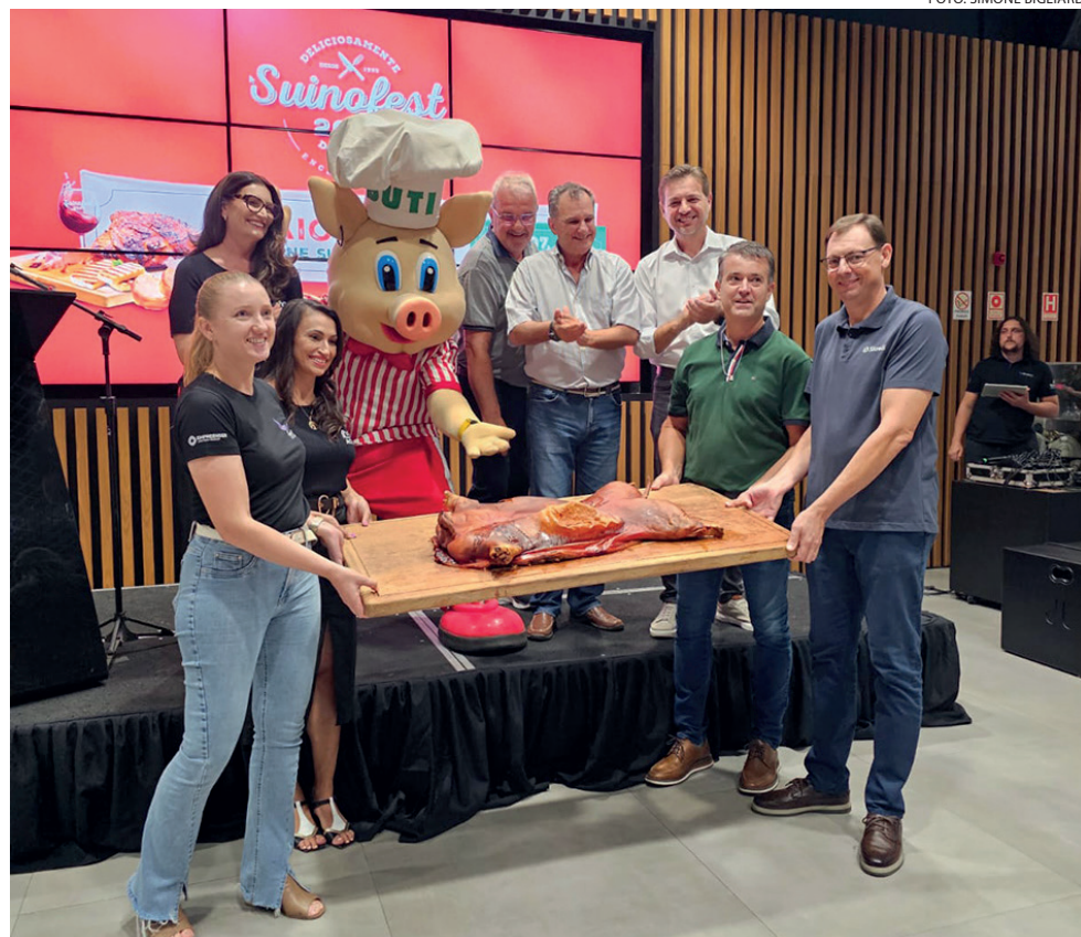
Lançamento da Suínofest 30 anos aconteceu na sede do Sicredi Região Dos Vales

Os ingressos estarão disponíveis a partir de segunda-feira (31) pelo site www.suínofest.com.br e dão direito a quatro horas com todas as bebidas e comidas inclusas.