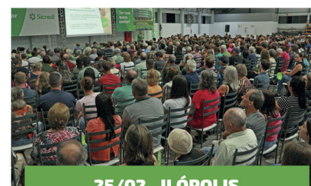
25/02 - ILÓPOLIS