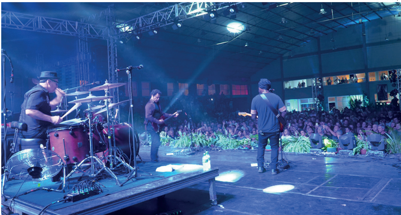
Competição musical inicia na sexta e sábado com a fase classificatória e domingo a final