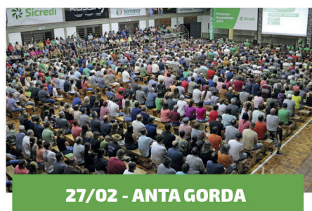
27/02 - ANTA GORDA