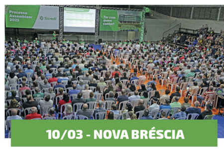
10/03 - NOVA BRÉSCIA