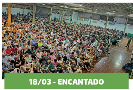
18/03 - ENCANTADO