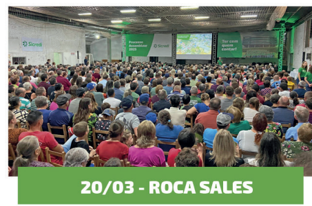
20/03 - ROCA SALES