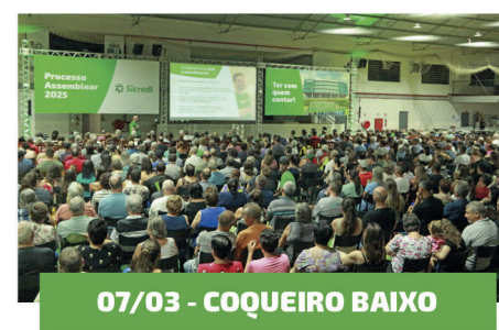
07/03 - COQUEIRO BAIXO