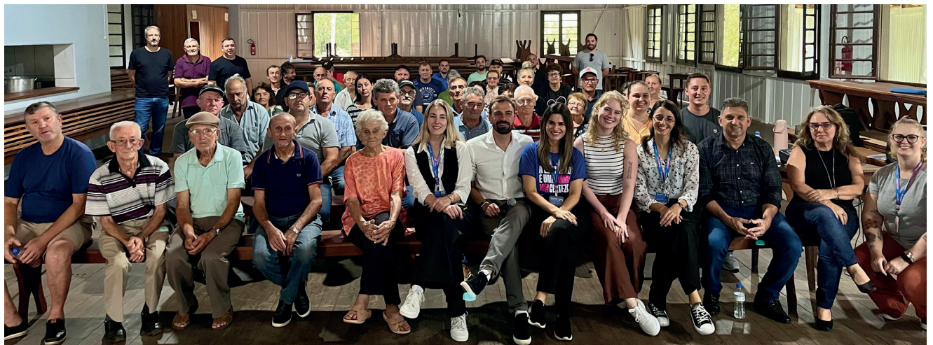
Em Muçum ocorreram audiências públicas ouvindo a comunidade rural e urbana