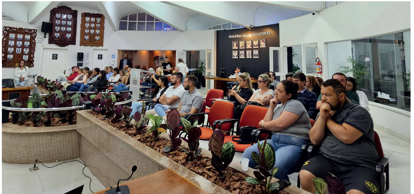
Audiência pública que ocorreu na noite de quinta-feira teve participação das ONGs e dos protetores dos animais