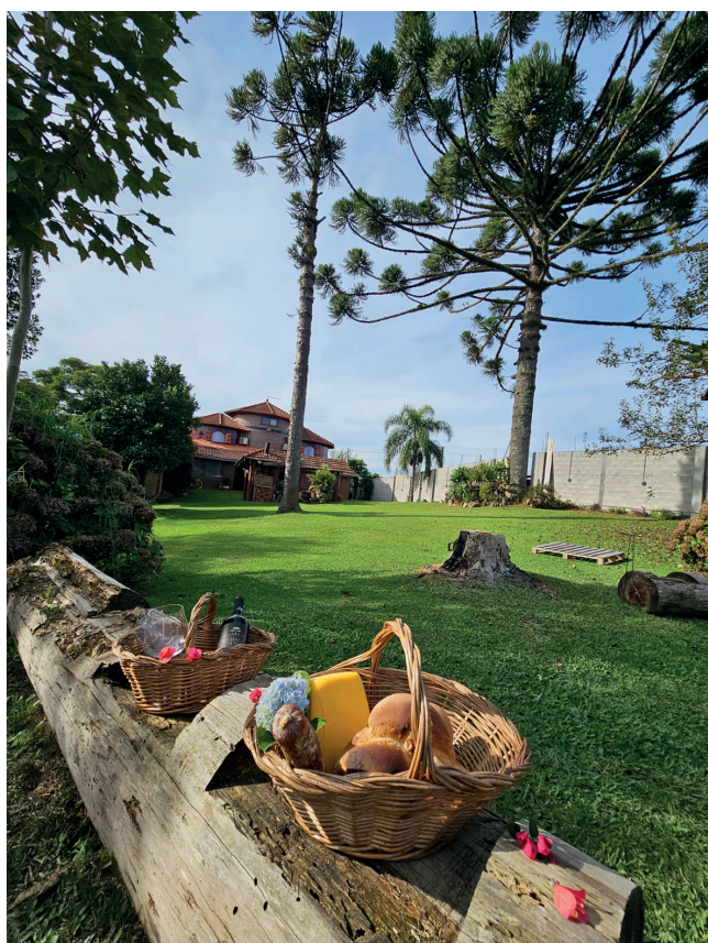
O grande pátio é ideal para um piquenique

São Valentim do Sul, Rio Grande do Sul. Reserva de duas diárias na Cabana Aconchego R$ 1.942,00 e no Recanto das Pipas R$ 2.949,50. Mais informações pelo WhatsApp (54) 9628.1047, pelo Instagram: @recantodaspipas.official ou Facebook: Recanto das Pipas - Pousada & SPA.