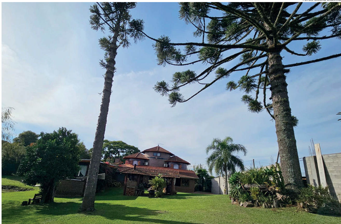
O Recanto das Pipas é uma hospedagem autêntica que oferece aos hóspedes muito conforto e aconchego

Nas duas opções de hospedagens está inclu-