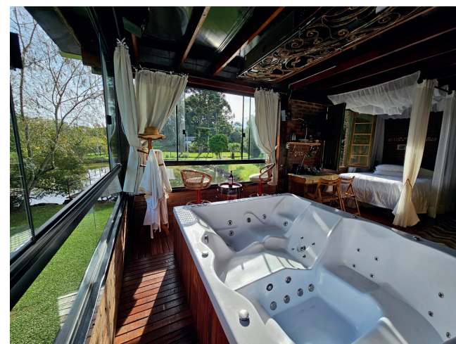
Cabana Aconchego e Recanto das Pipas tem jacuzzis