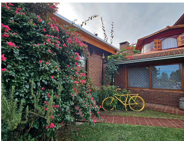
Cada canto do Recanto das Pipas é único