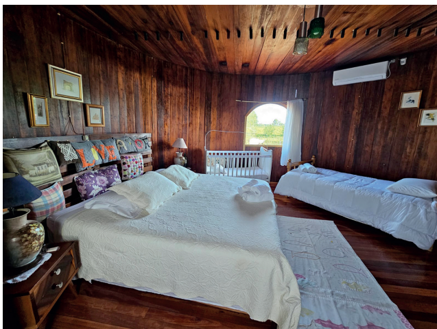
Recanto das Pipas tem três quartos