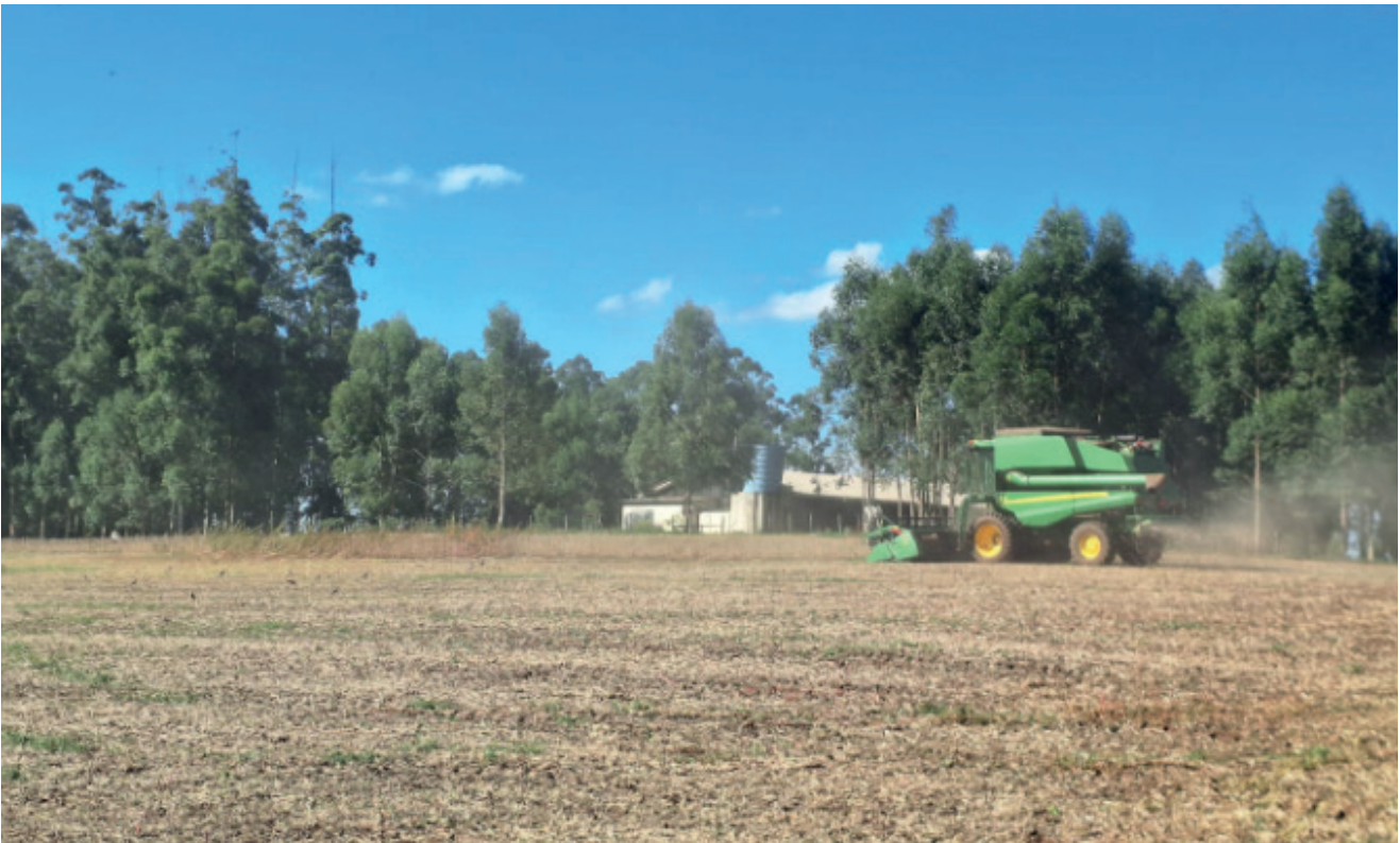
Colheita da soja na região ficou na média de 46 sacas por hectare

2,8 mil quilos por hectare, equivalente a 46 sacas. No entanto, a produção varia consideravelmente entre propriedades e municípios. Na safra anterior (2023/2024), a produtividade foi de 3,3 mil quilos por hectare. A região da Emater Vale do Taquari e Rio Pardo é a menor em representatividade na cultura da soja do Estado. As maiores regiões produtoras da cultura estão em Bagé com 1.097.601 ha de área plantada, seguida por Santa Maria com 1.059.108 ha de área plantada e Ijuí com 991.735 ha de área plantada de soja. Por isso a queda da produção na região do Vale do Taquari e Rio Pardo não causa grandes prejuízos ao setor primário, comparado a outras regiões do Rio Grande