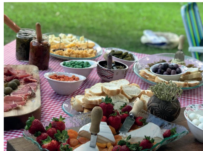
"Café dos deuses"