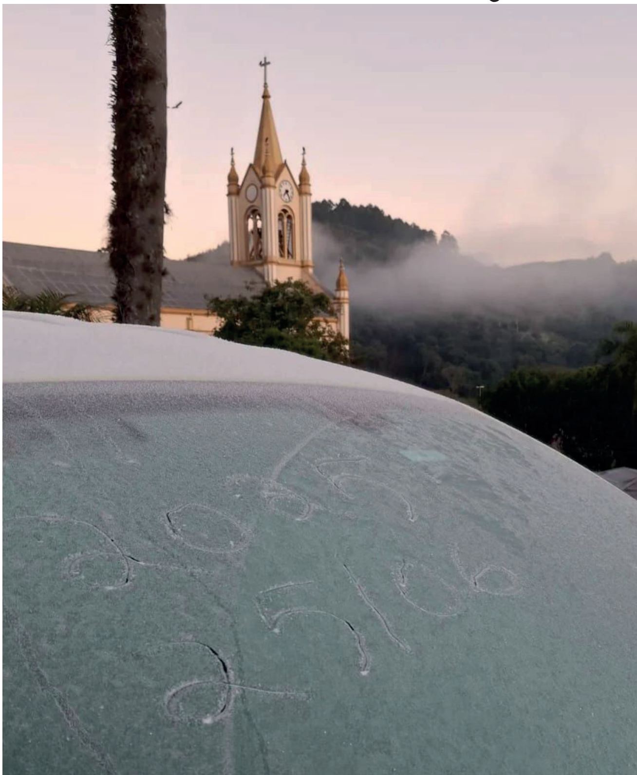
Em Relvado (foto) a geada congelou o para-brisa de veículos, em Putinga a mínima foi de -6^{\circ}\text{C}

A região sul do Brasil está localizada em uma zona de latitudes médias, considerada uma área de fronteira climática, o que a torna suscetível à atuação de diversos sistemas atmosféricos. A frente fria é o principal sistema meteorológico no período, provocando chuvas e, na sua retaguarda, permitindo a entrada de massas de ar frio — estas, sim, responsáveis pela queda nas temperaturas. "Nem todo dia é frio. É