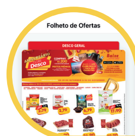
Todas Nossas Ofertas