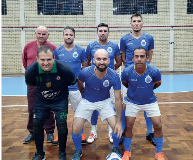
Final da categoria Livre EC Cruzeiro x EC Confiança