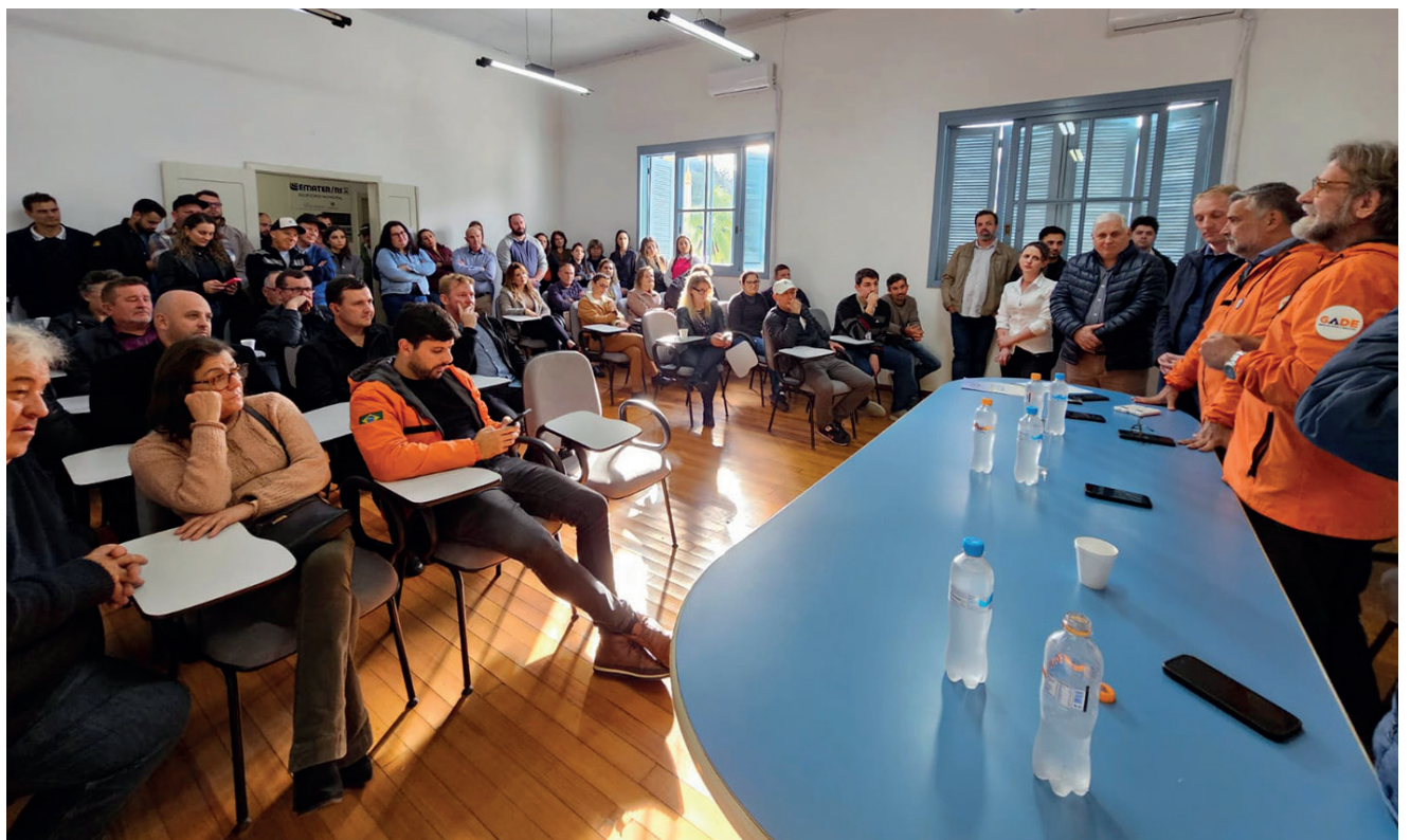
O anúncio ocorreu no Centro Administrativo Municipal de Relvado

Após o anúncio a comitiva visitou outras duas obras em andamento e executadas com recursos da Defesa Civil Nacional: a nova Unidade Básica de Saúde (UBS) e o muro gabião na Avenida Independência.