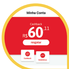
Sua Economia Usando Clube Desco (MENU CONTA > ESTATÍSTICAS)