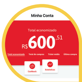
Cashback (MENU CONTA > CASHBACK)