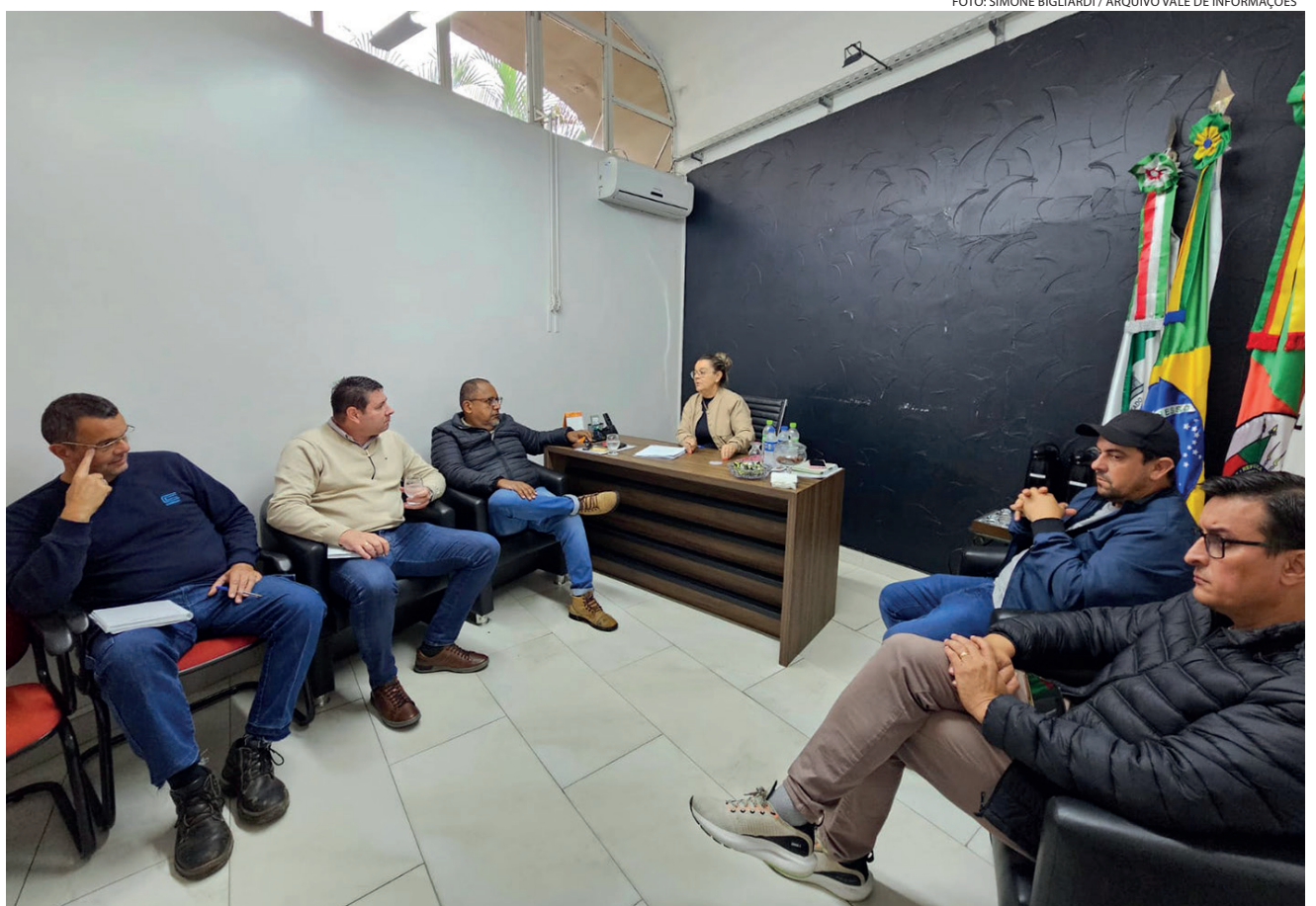
Vereadores de Encantado já estiveram reunidos com a Corsan/Aegea no dia 21 de maio

A Câmara reitera seu compromisso com a população e seguirá acompanhando de perto a situação, cobrando ações que tragam melhorias para o município de Encantado. Essa é a segunda reunião que os Legisladores terão com a direção da Corsan para cobrar melhorias no abastecimento de água em Encantado, a primeira reunião ocorreu no dia 21 de maio, quando a Corsan já havia prometido melhorar o serviço.