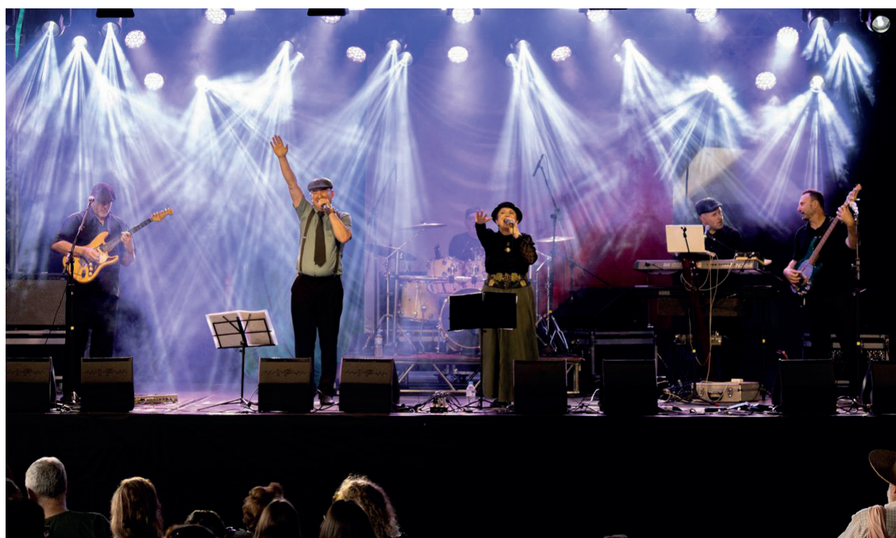
Ragazzi Dei Monti se apresentará na Settimana Italiana di Encantado

A Settimana Italiana é uma promoção da Prefeitura Municipal de Encantado, realização da Associação Cultural de Encantado com apoio da ASSIBRE.