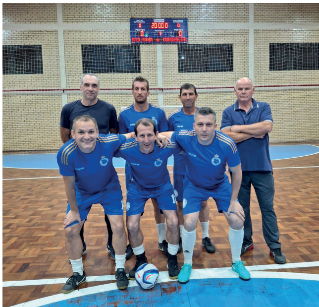
Final da categoria Veteranos EC Cruzeiro x Veteranos Relvado

O primeiro jogo da noite será pela disputa do 3º lugar entre as equipes dos Gambás e Matrix. O segundo confronto será pela decisão na categoria Veteranos, entre Cruzeiro e Veteranos Relvado. E a última partida da competição será decidir o título na categoria Livre, entre Cruzeiro e E.C. Confiança. Ao final dos jogos haverá entrega de troféu aos campeões, além de destaque para o goleiro menos vazado e para o goleador da competição.