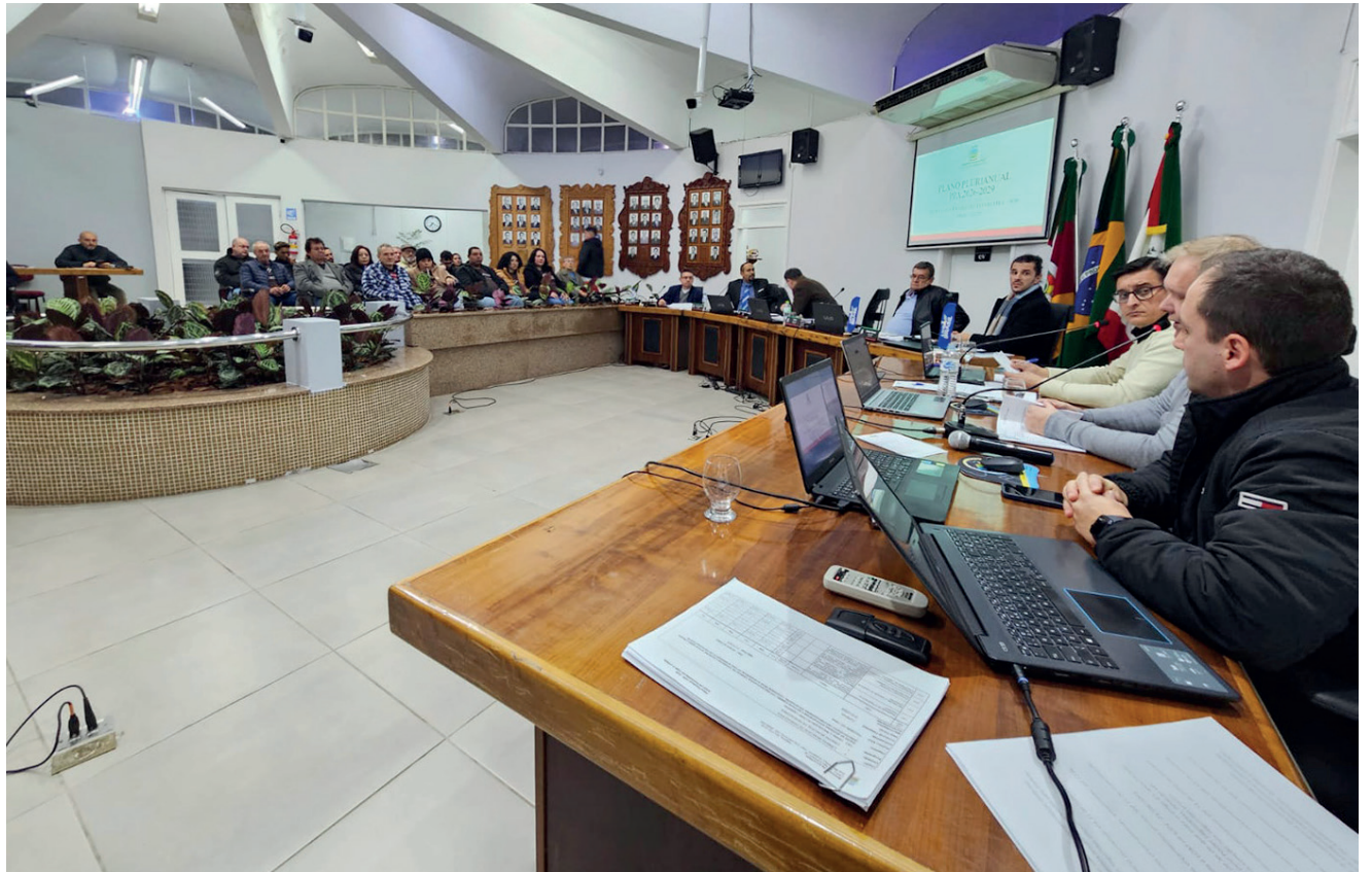
Câmara de Vereadores de Encantado esteve lotada para audiência do PPA

A questão da enchente também foi abordada, pedido por maior incentivo a cultura, com verba exclusiva para a área. A Associação Comercial e Industrial e a Câmara de Dirigentes Logistas, solicitaram a inclusão no PPA de valores para projetos de recuperação de solo na agricultura, repasse maior aos universitários, criação de verba para área do novo Distrito Industrial e também verba para estrutura de terrenos de novas moradias para suprir o