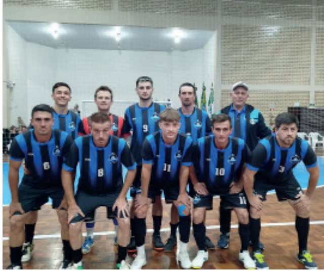
Final da categoria Livre EC Cruzeiro x EC Confiança

A grande final do Campeonato Municipal de Futsal de Relvado - Copa Sicredi teve que ser adiada e acontecerá no domingo (6), a partir das 17h no Ginásio Municipal de Esportes.