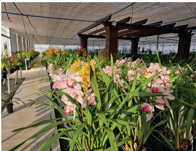
No Bella Orquidário o visitante tem a opção de escolher entre centenas de espécies