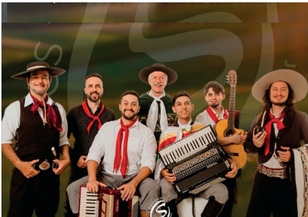
Os Serranos se apresentam sem cobrança de ingresso na Praça Júlio Lengler