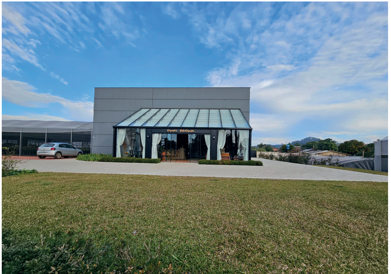
O Bella Orquidário está localizado próximo ao trevo de acesso principal de Guaporé

O cliente pode adquirir orquídeas a preços especiais, além de aproveitar todo o entorno que tem uma fonte, um caminho de pedras e um grande gramado para relaxar. No Bella Orquidário, também tem um espaço de descanso para sentar e tomar uma água ou café. O belo empreendimento está localizado próximo ao trevo principal de acesso a Guaporé,