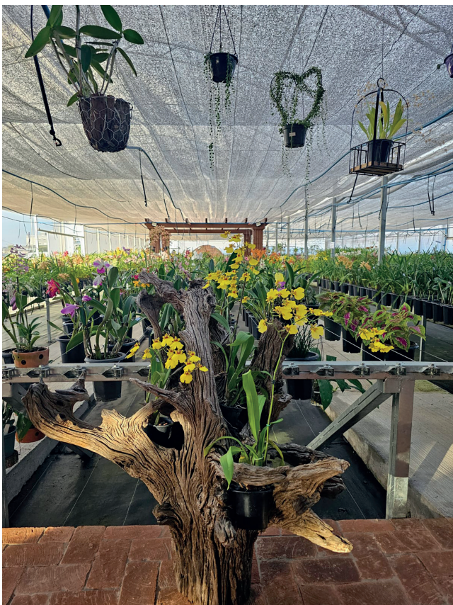
A beleza e o aroma do lugar encantam

Mais informações e detalhes podem ser obtidos pelo Instagram: @bellaorquidea_orquidario ou Facebook: Orquidário Bella Orquídea.