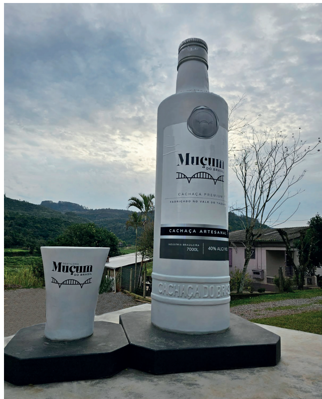
Estátua da garrafa mede 3,20 m e do copo 70 cm

Além disso, os proprietários tem um projeto para construir um outro pavilhão nos fundos da loja que será um espaço de vivência para as pessoas conhecerem o processo da fabricação da cachaça, poderem moer a cana e