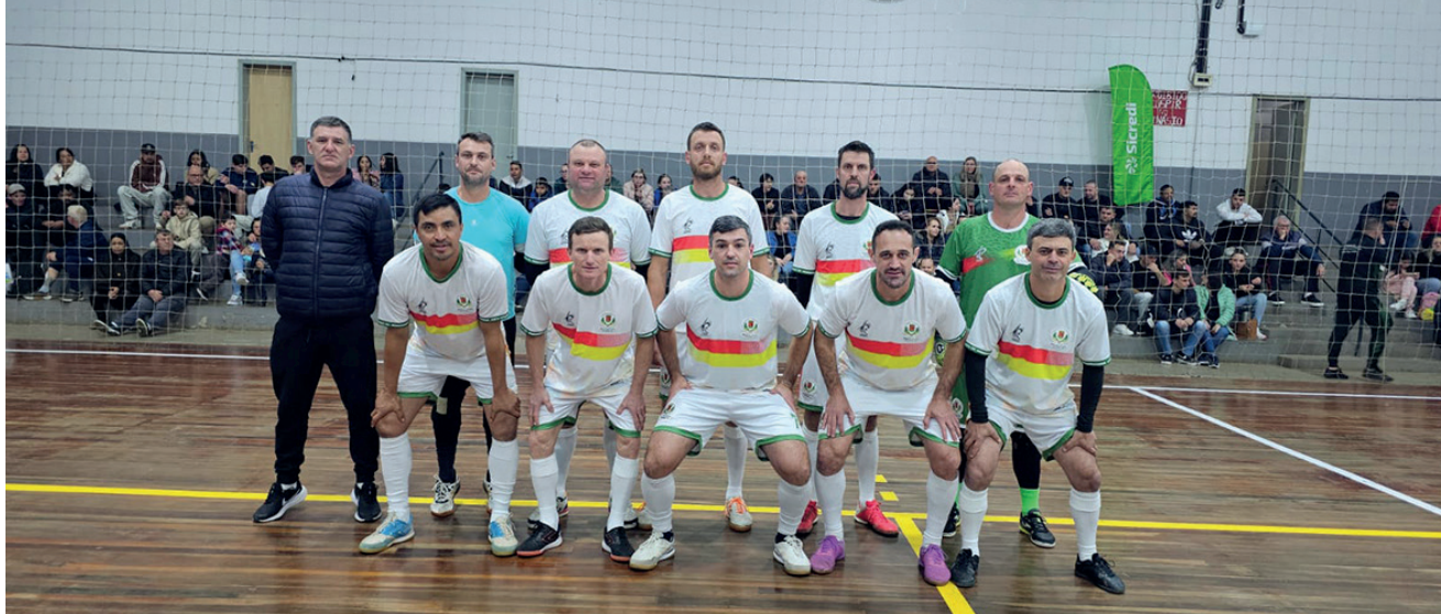
A equipe do veterano de Anta Gorda estreou na competição com uma vitória

Na noite de sexta-feira (15) aconteceu a abertura oficial da 1ª Copa AMAT de Futsal Amador - Copa Sicredi no ginásio do Centro Social Urbano de Roca Sales.