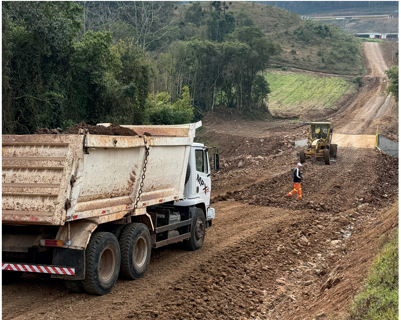
O asfaltamento do trecho na Linha Poço da Laje iniciou no sábado (16), quatro dias após a inauguração da nova ponte na comunidade que liga Relvado a Doutor Ricardo

Importante ressaltar que no período de execução da obra, o trânsito pela ponte estará interrompido, sendo possível acessar a estrada que leva ao município de Doutor Ricardo e a outras comunidades pelo Parque Municipal de Rodeios, desvio utilizado quando a ponte ainda estava interditada. Conforme a Administração Municipal a execução ainda não tem prazo para conclusão. O valor de investimento é oriundo de recursos próprios do Município de Relvado e emendas conquistadas.