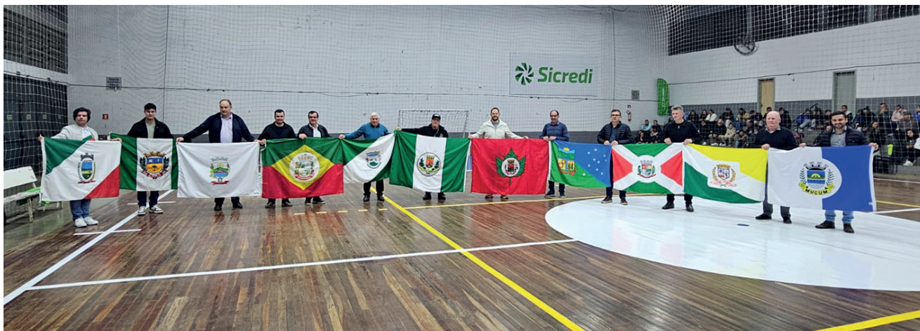
Prefeitos e representantes de todos os municípios na abertura oficial da Copa AMAT

Após a abertura, a bola rolou em quatro bons jogos. A primeira partida, foi pelo veterano e teve a vitória de Anta Gorda por 7 a 2 frente a Guaporé. Na sequência, foi a vez de Guaporé vencer Anta Gorda, na categoria livre, o placar foi de 6 a 4. No terceiro jogo, a equipe do veterano de Encantado venceu Roca Sales por 5 a 2. Os donos da casa, Roca Sales, devolveram a derrota para Encantado no último jogo da noite, pela categoria livre, vencendo por 5 a 2. A segunda rodada acontece na noite desta sexta-feira, em três praças esportivas diferentes. Em Guaporé, a partir das 19h no Ginásio Poliesportivo: veteranos Encantado x Anta Gorda, após os dois municípios se enfrentam pela categoria livre. O terceiro jogo será pelos veteranos Guaporé x São Valentin do Sul e após os dos municípios jogam pela livre. Em Arvorezinha, a partir das 20h, pelo feminino Encantado x Guaporé, na livre Putinga x Relvado e após Arvorezinha x Ilópolis. E em Vespasiano Corrêa, a partir das 19h pelos veteranos Muçum x Travesseiro, após os dois municípios se enfrentam na livre, o terceiro jogo da noite é pelos veteranos, Vespasiano Corrêa x Capitão, e na sequência os dois municípios jogam pela categoria livre.