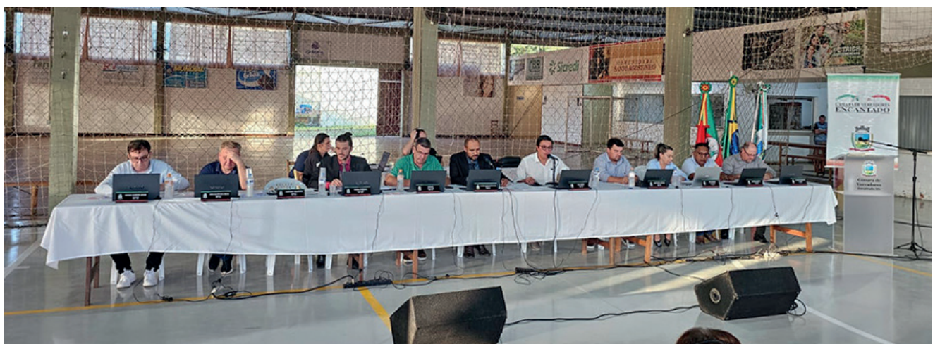
Vereadores na sessão itinerante no bairro Planalto, Comunidade de Santo Agostinho