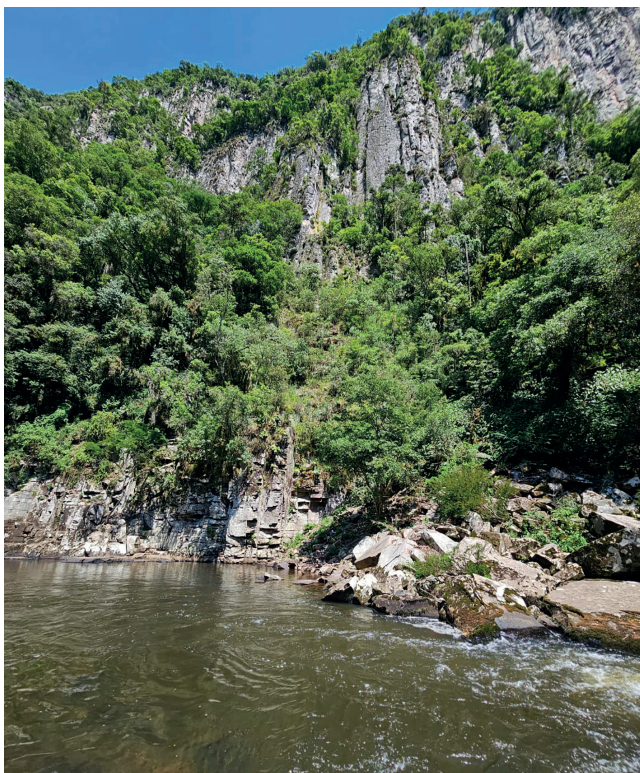
Perau fica bem ao lado do Rio Forqueta

a partir da metade de dezembro será de quarta a domingo, a entrada é R$ 25. Para acampar com barraca é preciso agendar. Também há cabanas que podem ser locadas antecipadamente. O local tem serviço de alimentação. Para chegar ao Perau de Janeiro é preciso seguir pela ERS 332 em Arvorezinha em direção a Soledade, na beira da estrada tem uma placa, dali em diante são 9 km de estrada de chão. Mais informações no WhatsApp (51) 9986-1404.