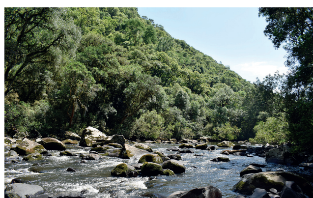
Travessia pelo Rio Forqueta