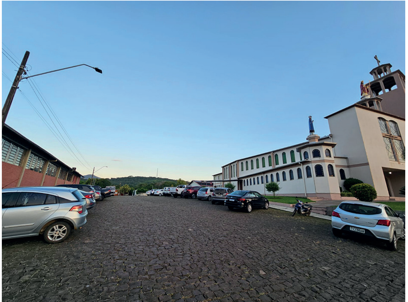
Comunidade pediu a cobertura da rua entre a Igreja e o salão

E o projeto 92 que abre créditos especiais de R$ 1.029.000,00 que remaneja recursos do orçamento, para a secretaria da Saúde onde será aplicado nos serviços de saúde prestados pelo Hospital Beneficente Santa Terezinha e outros.