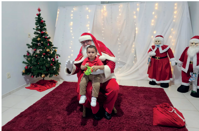
Espaço do Papai Noel