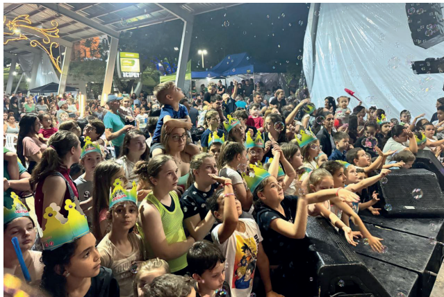
Shows infantis e musicais