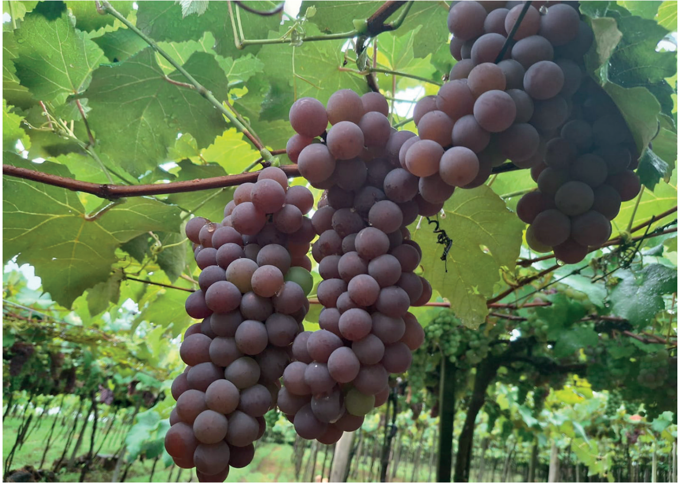
O evento também terá a abertura da colheita da uva da Família Franchini no domingo a partir das 8h