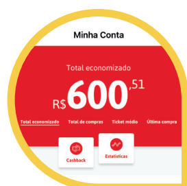
Cashback (MENU CONTA > CASHBACK)