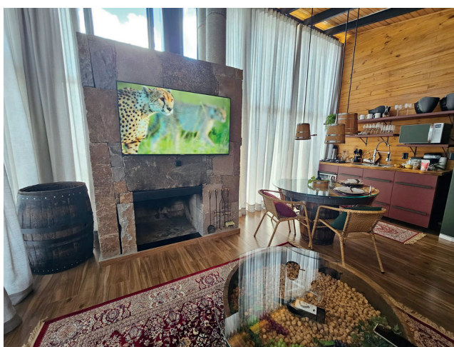
Espaço de sala e cozinha integrado com lareira