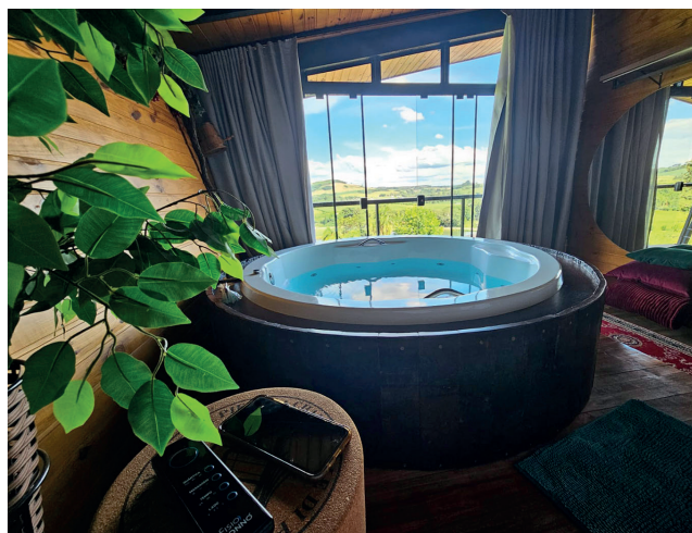
Banheira de hidromassagem tem vista deslumbrante