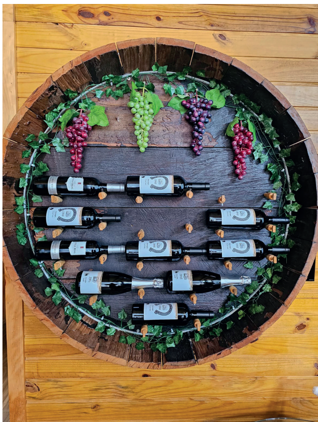
A bela decoração do Videira tem vinhos, pipas, uvas

Sendo que em finais de semana a reserva mínima é de duas diárias, e durante a semana uma. Para saber mais siga @chalessvalledipietre ou chame no WhatsApp: (54) 9279-3823