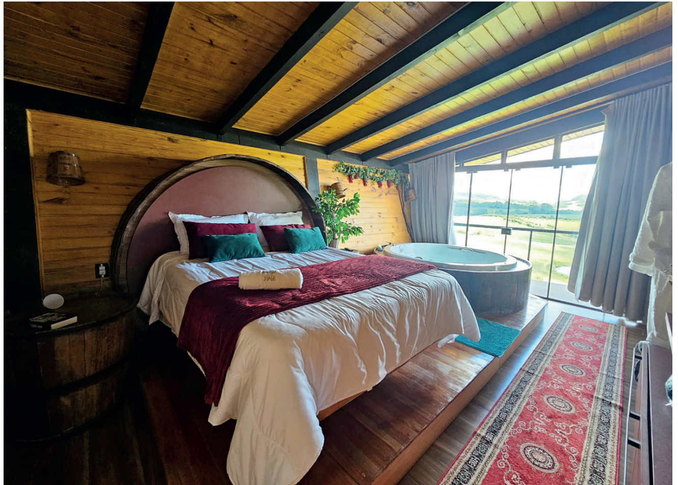
Suíte do Chalé Videira com decoração linda, aconchego e muito conforto para você descansar

O Chalés Valle Di Pietre tem cinco opções de estadias temáticas incríveis. Além do Videira, que está apresentado através das fotos, tem também: o Potro Negro, do Trem, Doce Ovelha e Natura. Cada um com uma decoração exclusiva e rústica e com opções de hospedagem para casal, até para famílias com três quartos. Todos com uma suíte com banheira de hidromassagem, comando de voz, e total-