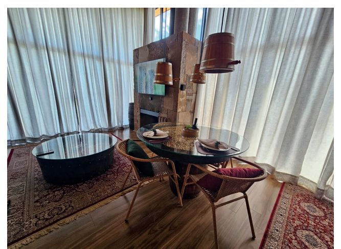
Chalés tem todos os comandos através da Alexa