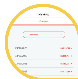
Seu Histórico de Compras