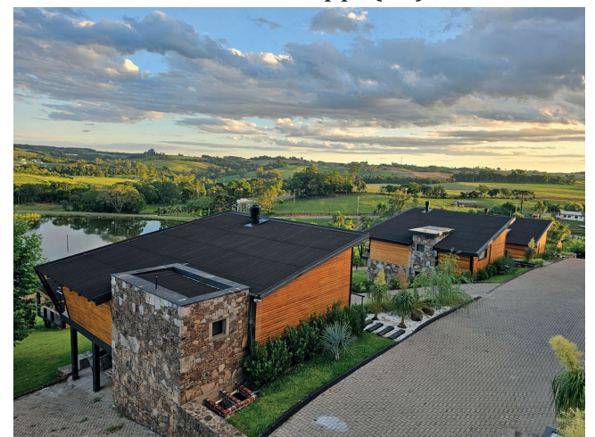
A beleza do lugar encanta os hóspedes