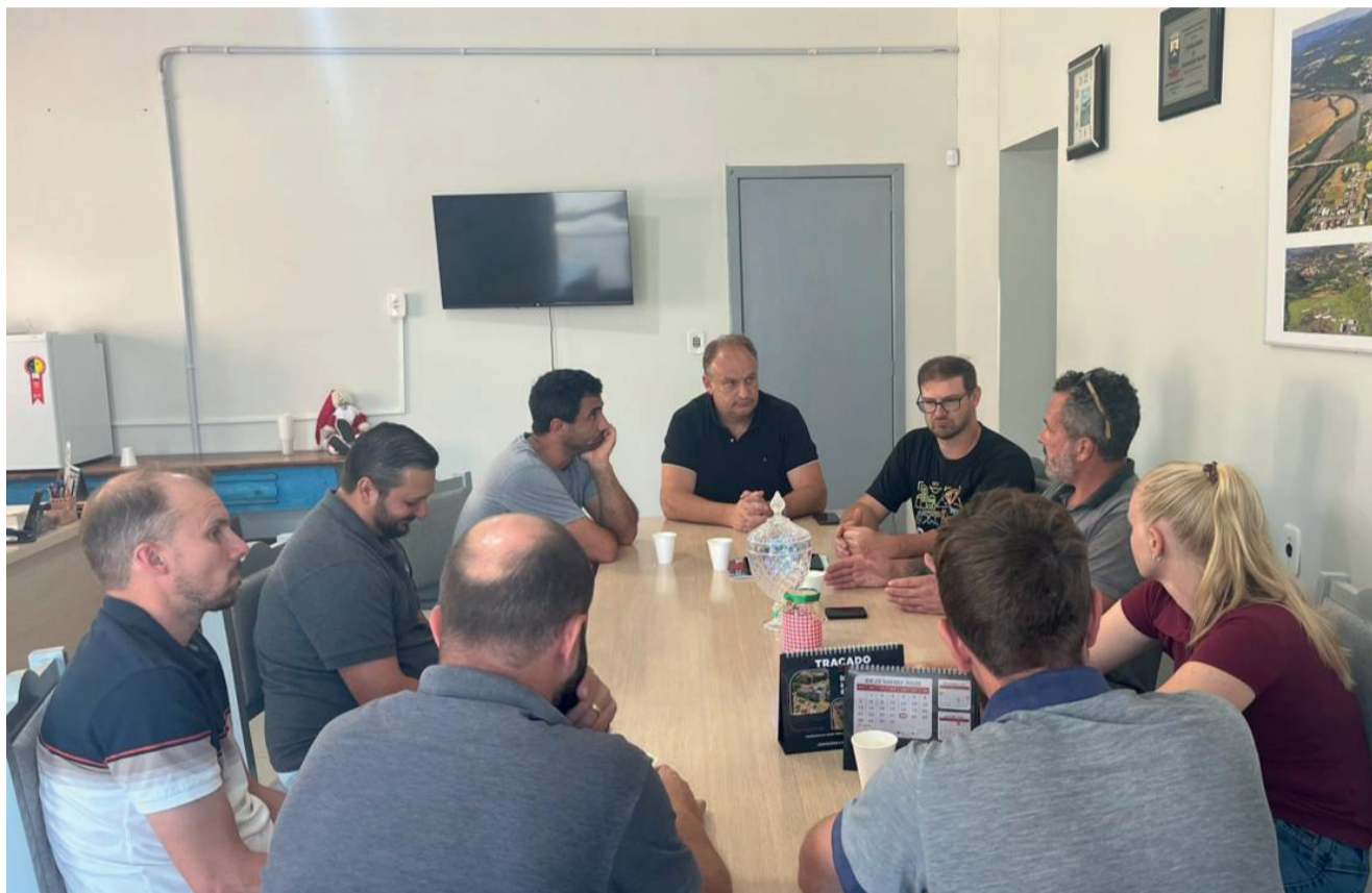
Reunião ocorreu na terça-feira, no Gabinete do prefeito

Outro tema abordado foi a causa animal. A Administração Municipal está elabo-