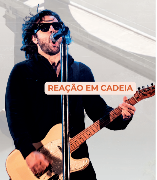
REAÇÃO EM CADEIA