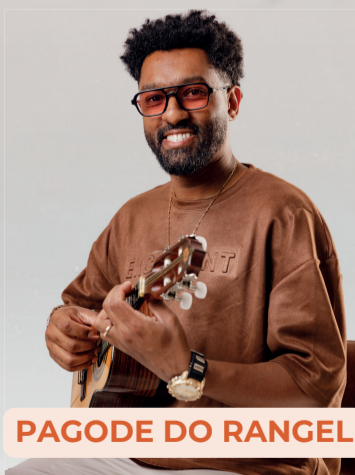
PAGODE DO RANGEL