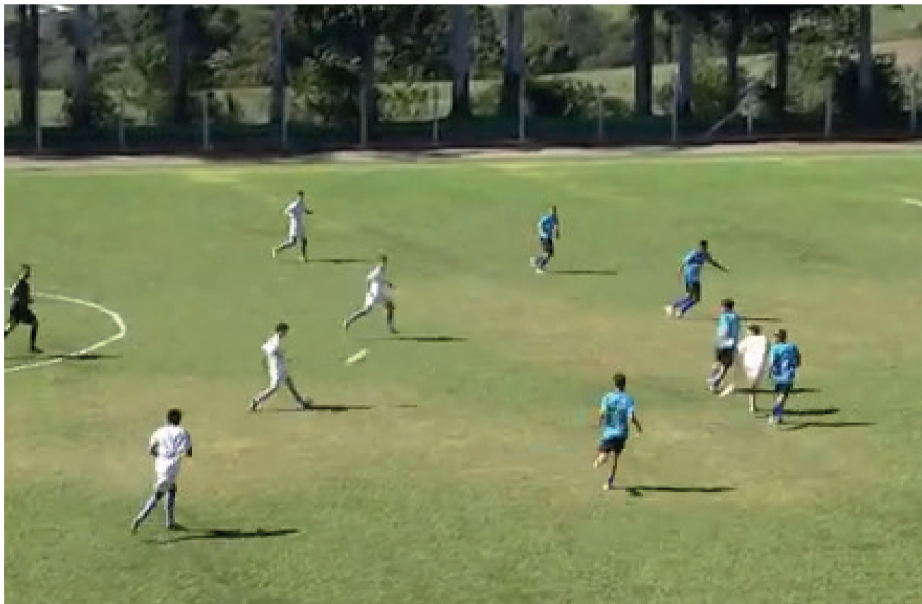
Primeira edição apresentou grandes jogos

A 2ª Taça Guaporé de Futebol – Categoria de Base Sub-15, será disputada entre os dias 7 e 12 de abril. O evento esportivo é realizada pela Eze Eventos Esportivos, com apoio da Administração Municipal de Guaporé, por meio da Secretaria de Turismo, Cultura e Esporte, Conselho Municipal de Desporto (CMD) e envolvimento de outras pastas. A competição contará com 12 times: E.C. Passo Fundo/Guaporé, Grêmio, Internacional, Juventude, Caxias, Novo Hamburgo e São José (Rio Grande do Sul); Azuriz e Cascavel (Paraná); Barra e Chapecoense (Santa Catarina); E.C. Bahia (Bahia). Os jogos serão disputados nos estádios General Ernesto Dorneles (campo do Juventude) e Albino Pasquali. A expectativa, conforme destacou o diretor de Esportes, Vitor Hen-