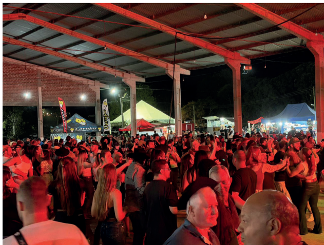
Shows e baile atraíram multidão

“Neste ano o Porteira da Amizade completará 40 anos e, depois de tudo o que passamos com a enchente, em 2024, o ano de 2026 está sendo muito especial. No dia 27 de março reinauguramos o nosso galpão que havia sido destruído pela enchente e agora realizamos um dos maiores rodeios da história. Tudo isso graças à união e às pessoas, que acreditam no Porteira e no município de Relvado. Obrigado a todos”, agradece.