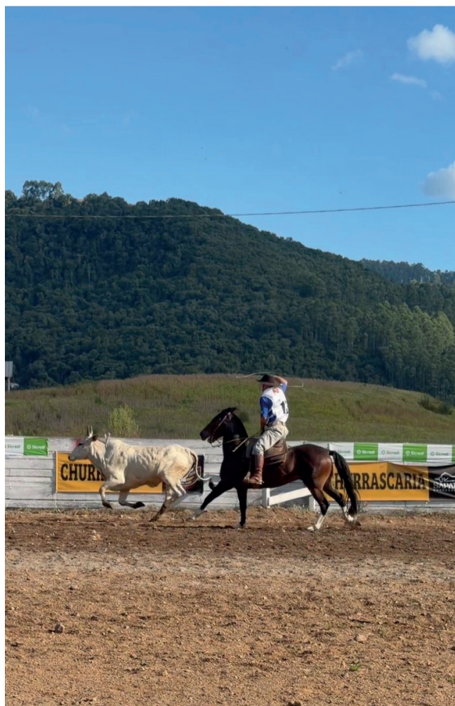
Provas campeiras reuniram muitos competidores

“A Administração Municipal é sempre uma grande parceira do CTG na promoção do rodeio, por meio de todas as secretarias, que trabalham conjuntamente para o sucesso do evento. Desde a infraestrutura do parque até os shows, buscamos sempre investir para que todos tenham a melhor experiência possível em nosso evento. Neste ano, registramos uma grande participação do público