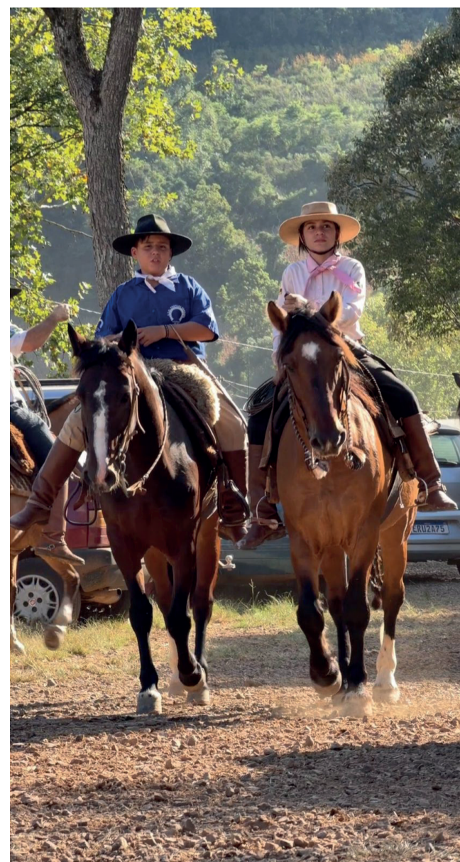
Rodeio de Relvado é um dos maiores da região