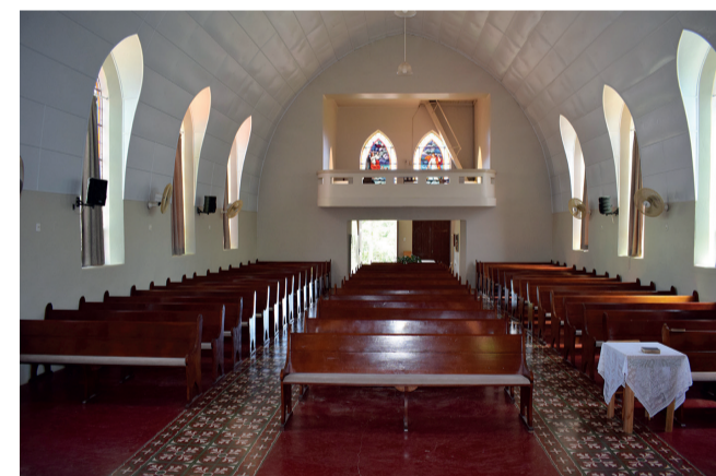
Igreja na parte interna também impressiona pela sua beleza e espiritualidade