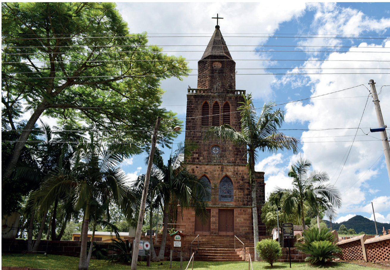
Bela construção é um dos destaques do Vale do Taquari

A Igreja de Pedra de Forqueta Arroio do Meio No início do Século XIX chegavam no Distrito de Arroio do Meio, através do Rio Forqueta, imigrantes alemães que haviam passado pela região de Nova Petrópolis. Eram evangélicos e protestantes que com muito trabalho construíram a comunidade de Forqueta. Em 1880 foi adquirida a área para construção da Igreja, Escola e Cemitério da Comunidade Evangélica de Forqueta. Em 1881 a Escola estava construída, o prédio servia também para a realização das celebrações religiosas até a conclusão da primeira Igreja, que era mista e foi consagrada em 26 de abril de 1896. Forqueta foi crescendo chegando a ter mais de 300 famílias, fazendo a Igreja se tornar pequena. Até que em 1947 a Comunidade iniciou a construção da atual Igreja de Pedra. As pedras foram retiradas as margens do Rio Forqueta em uma área de terra da comunidade e eram levadas de carroça até a obra. Lá eram esculpidas a mão, por isso, não existe nenhuma pedra igual a outra. A construção dos 290m 2 e da torre principal que tem 26 metros de altura foi coordenada pelo engenheiro Jacob Trentini e teve o auxílio de dois pedreiros, mas a maior parte da mão de obra foi de pessoas da comunidade que se revezaram para erguer o templo de fé. A inauguração oficial aconteceu em 1953, da antiga Igreja foram aproveitados alguns vitrais e o