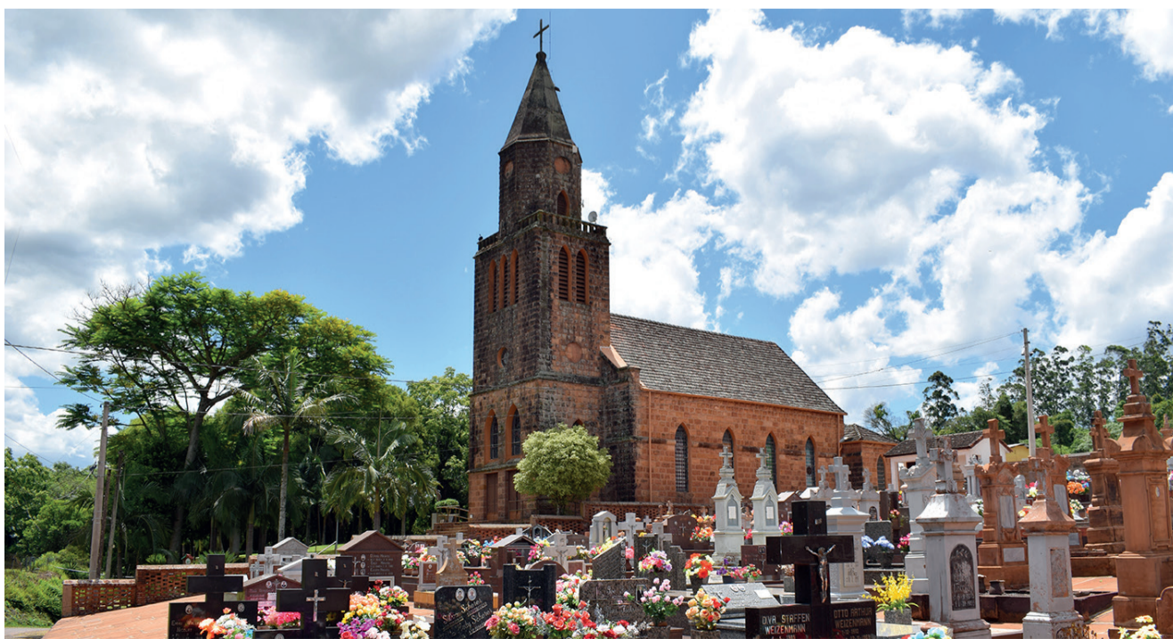
Ao lado da Igreja, o cemitério é um dos mais antigos da região