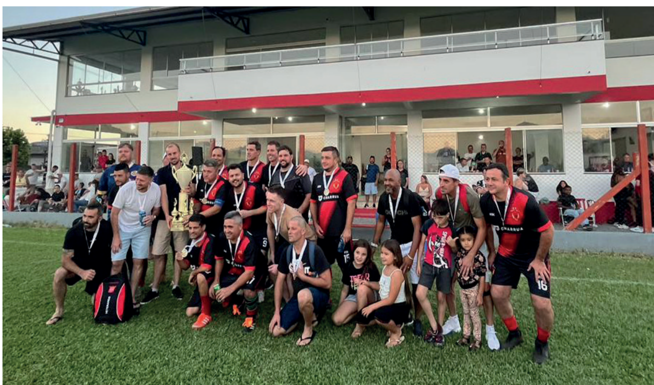
Vice-campeão Toma 10

O evento foi marcado pela participação ativa da comunidade, com torcedores incentivando suas equipes e fortalecendo o espírito esportivo. A Administração Municipal ressalta a importância do futebol amador como ferramenta de integração social e parabeniza todas as equipes, atletas e envolvidos pela organização e sucesso da competição.