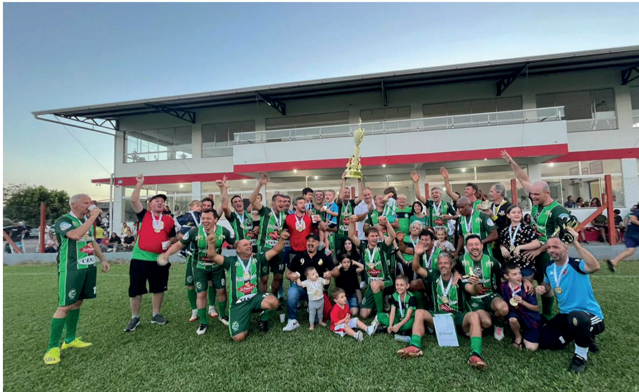
Juventude conquista o título no Municipal de Roca Sales pela categoria veterano

Grande público compareceu ao Campo do Concórdia, no domingo (19) para acompanhar a grande final do Campeonato Municipal de Futebol Amador na categoria Veteranos, além de mais uma rodada da Força Livre.