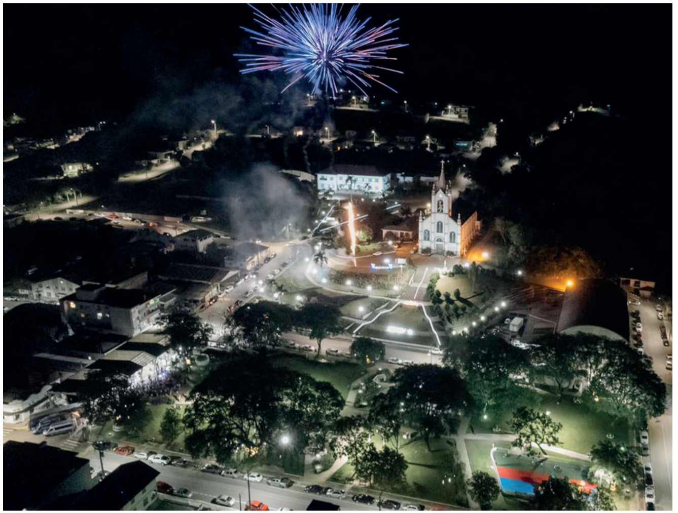
Aniversário do município terá programação intensa

Já no dia 22 de maio, a programação segue com o tradicional Filó Italiano, a partir das 19h, no Ginásio Municipal de Esportes. A animação da noite ficará a cargo do Grupo Passiones.