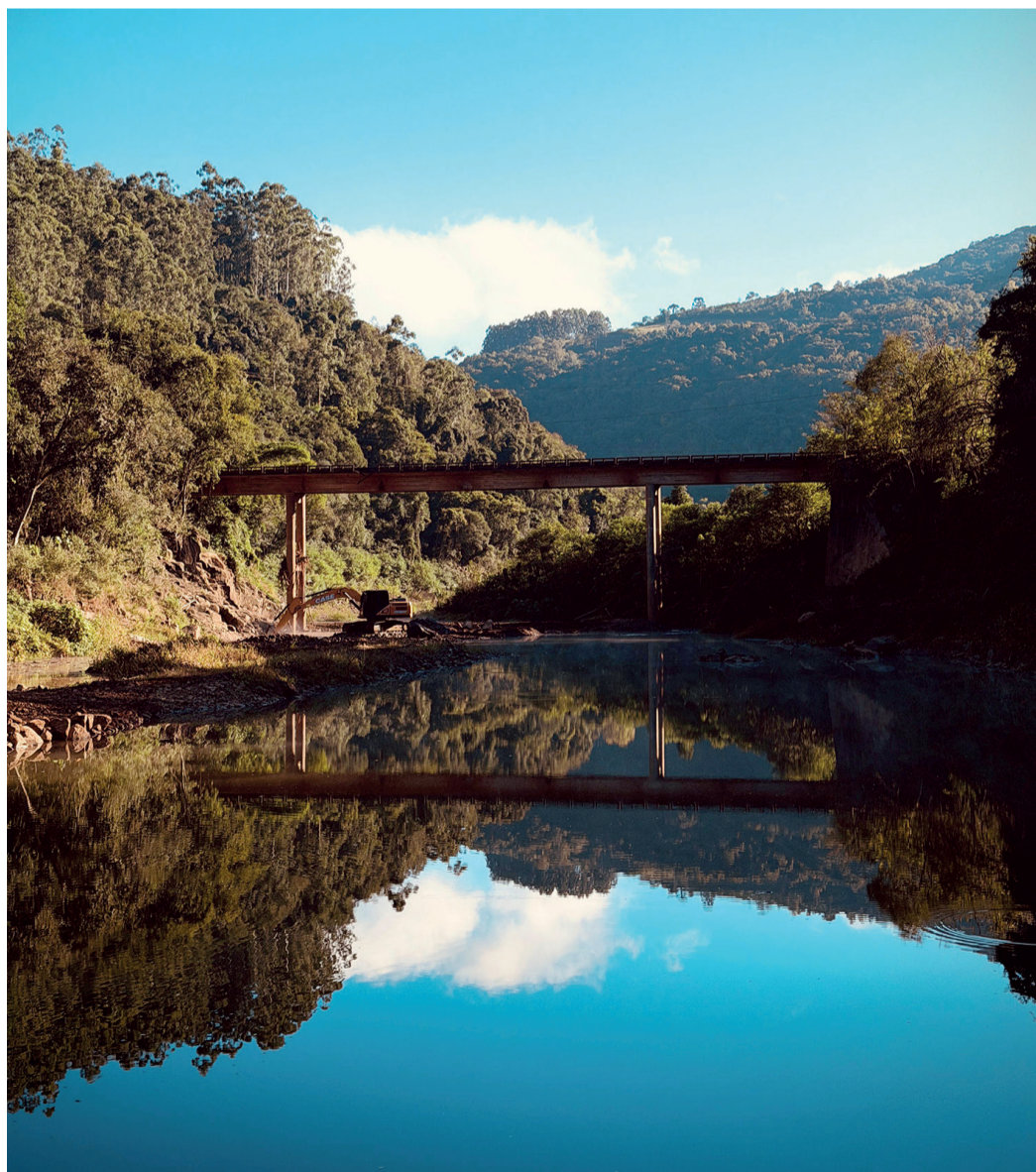
Nova ponte será construída na divisa dos municípios

A nova ponte promete devolver mobilidade e segurança aos moradores e usuários da ERS-433, restabelecendo a conexão essencial entre Relvado e Encantado.