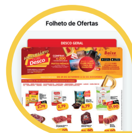
Todas Nossas Ofertas