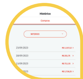
Seu Histórico de Compras