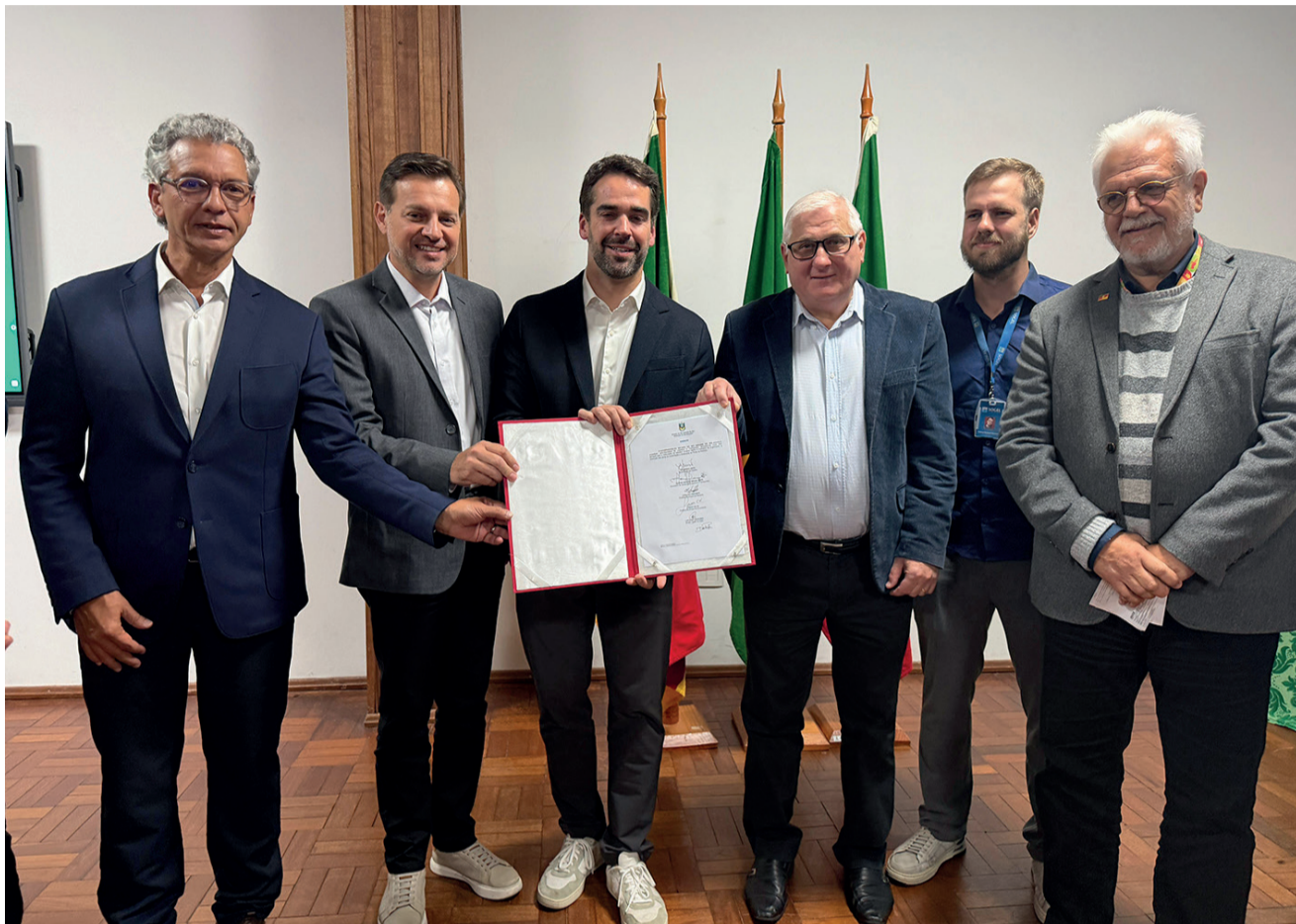
Governador Eduardo Leite com prefeitos de Encantado, Jonas Calvi e Relvado Carlos Luiz Fraporti

A obra será executada pela Construtora Sogel, com prazo de conclusão estimado em sete meses. A demolição da ponte atual está prevista para começar na próxima terça-feira, 5, abrindo caminho para a construção.